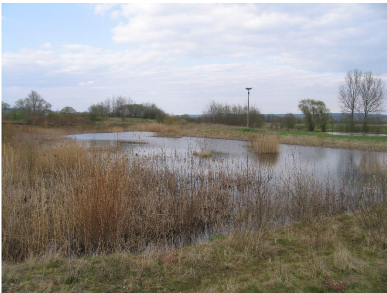
Aue Obersuhl (aus: Vogelschutzgebiet Nr. 5026-402 „Rhäden von Obersuhl und Auen an der mittleren Werra“ - Grunddatenerhebung 2008)