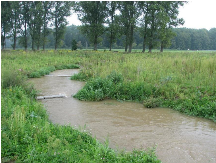
Untere Gersprenzaue