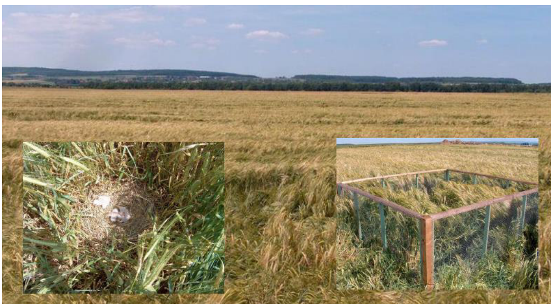
Gelegesicherung bei der Wiesenweihe im VSG „Wetterau“

FD, MR u.a. : Für die Gebiete, bei denen es sich offensichtlich um Ackerbruten handelt, ist grundsätzlich eine Gefährdung durch landwirtschaftliche Arbeiten anzunehmen. Diese kann jedoch nur eine intensivierete Beobachtungstätigkeit vor erkannt, räumlich konkretisiert und dadurch in Rücksprache mit den Landwirten verhindert werden.