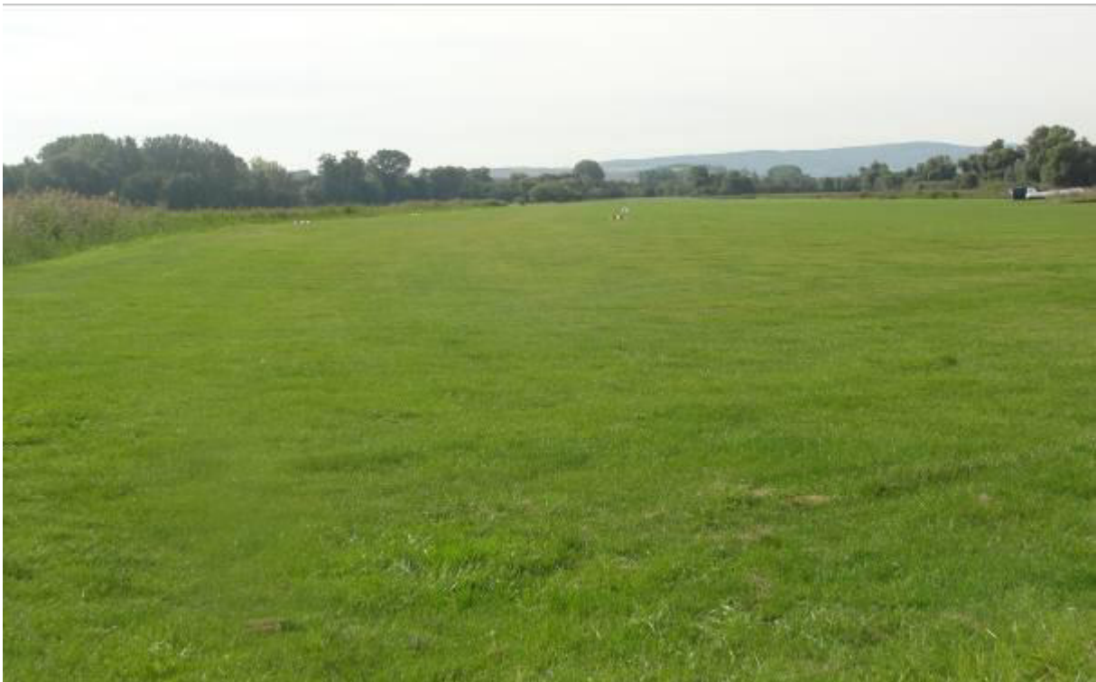
Flugplatz direkt am Südrand des Reinheimer Teiches als Quelle intensiver Störungen

- Markierung des Erdseils aller Hochspannungsfreileitungen innerhalb und im Umfeld des VSG zur Reduzierung des Anflugrisikos.