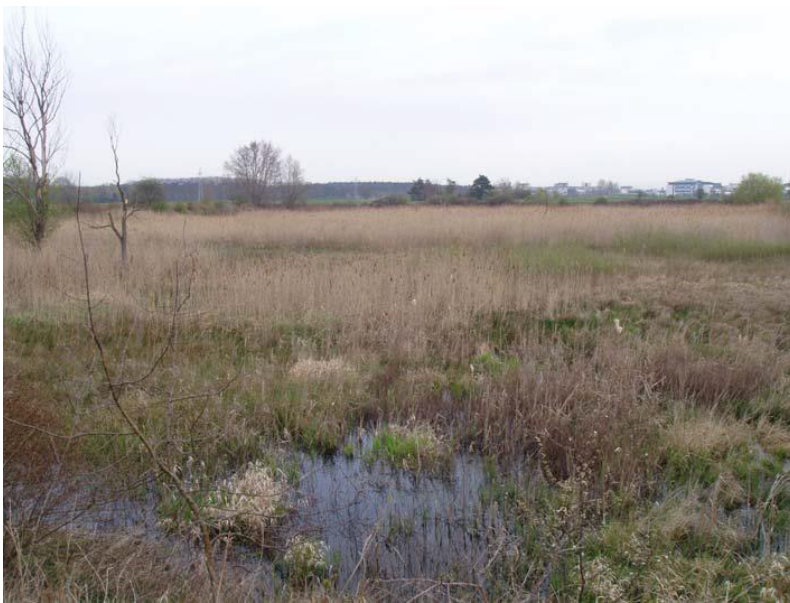
NSG „Schaeppeensee“ (aus Böger & Eppler: GDE VSG 6016-402 „Streuobst-Trockenwiesen bei Nauheim und Königstädten“)

- Es muss gewährleistet sein, dass es zu keiner zu starken Wasserentnahme durch das in der Nähe befindliche Wasserwerk „Schönauer Hof“ kommt.