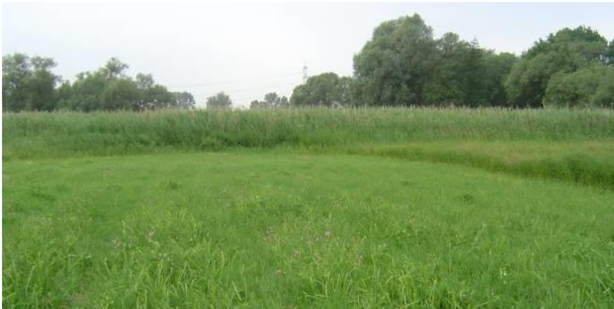
Regelmäßig besetzter Brutplatz in der Schwarzbachau östlich Trebur („Erlenwiese“ bei Groß-Gerau) im VSG „Hessische Altneckarschlingen“