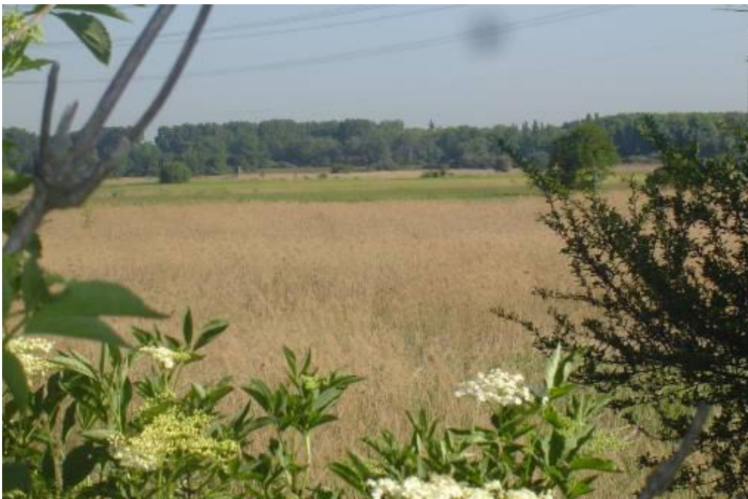
Lochwiesen bei Biblis mit Hochspannungsfreileitung