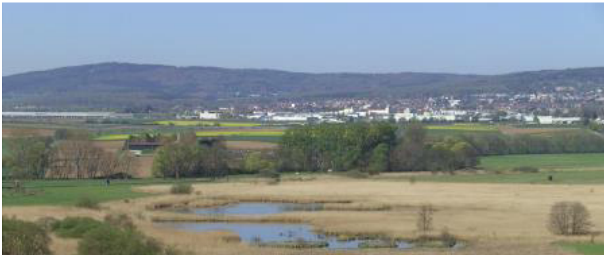
Die „Klosterwiesen von Rockenberg“ im VSG „Wetterau“ als regelmäßig besetzter Brutplatz der Rohrweihe