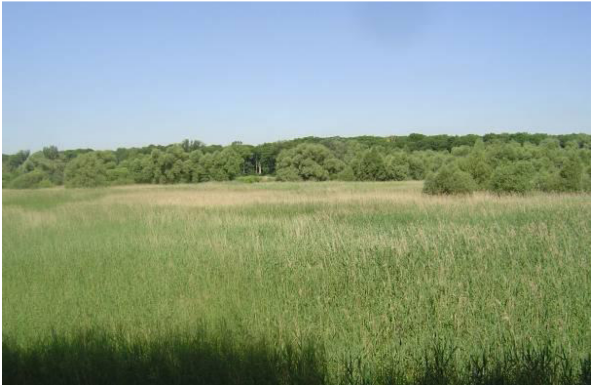
Ausgedehntes Röhricht im NSG „Kühkopf-Knoblochsau“