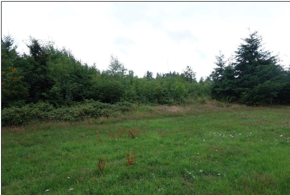
Abbildung 2: Der Windwurfbereich weist eine stark ausgeprägte Verbuschung oder weit vorangeschrittene Wiederaufforstung auf. Diese Areale grenzen ohne Übergangshabitate, wie z.B. einen gestuften Waldrand, an Grünlandflächen. Gehölzarten wie z.B. Hänge-Birke, Berg-Ahorn, Eberesche oder vereinzelte Haselnusssträucher bilden mit jüngeren Fichten die Hauptvegetation.