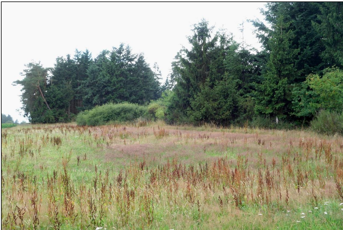
Abbildung 4: Angrenzend an die Waldlebensräume lässt sich durch die Etablierung eines gestuften Waldrandes aus einheimischen, standortgerechten Gehölzarten eine Aufwertung der Strukturvielfalt erzielen.