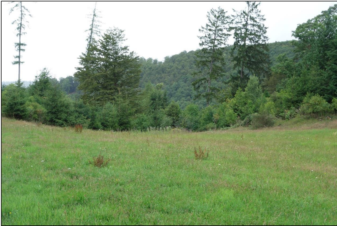
Abbildung 5: Das Raubwürger-Revier ist gleichzeitig Bruthabitat des Baumfalcken. Im Bild lassen sich die weit eingeschnittenen Täler der Orke erahnen. Licht bzw. einzeln stehende Fichten oder Fichtengruppen bilden einen wichtigen Habitatbestandteil eines Raubwürger-Reviere, da sie als Ansitzwarte, Ruhestätte oder als einer der ersten Ausflugsorte gerade flügger Jungvögel dienen. Sie gewähren eine für die Art essenzielle, weiträumige Rundumsicht.