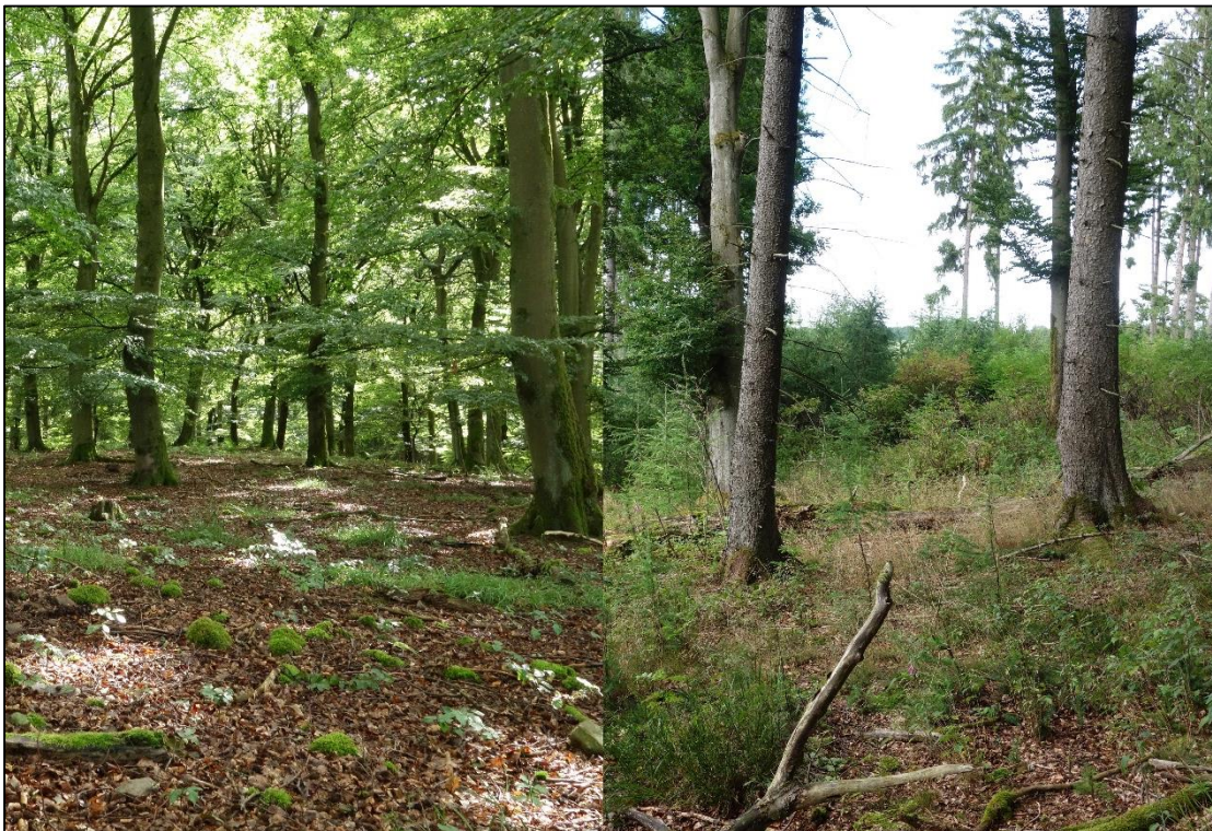
Abbildung 6: Sofern sich die Habitatgegebenheiten auf dem Windwurf verbessern und auf den Flächen des angrenzenden Grünlandes die Strukturvielfalt erhöht wird, ist ein regelmäßiger Besatz des Reviers zu erwarten. Grundsätzlich hat das UG hohes Potenzial, wie es auch die Waldlebensräume zeigen.