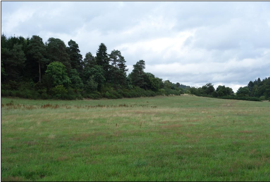
Abbildung 3: Das gesamte Revier hat großes Aufwertungspotenzial, sowohl im Hinblick auf die Bewirtschaftung des Windwurfbereichs, als auch hinsichtlich des Grünlandbestandes, der von zahlreichen Hecken umgeben ist. Mit einer angepassten Bewirtschaftungsform sowie dosierter Anpflanzung von niedrigwüchsigen Gehölzen, ist ein schneller Attraktivitätszuwachs für zahlreiche Arten zu prognostizieren.