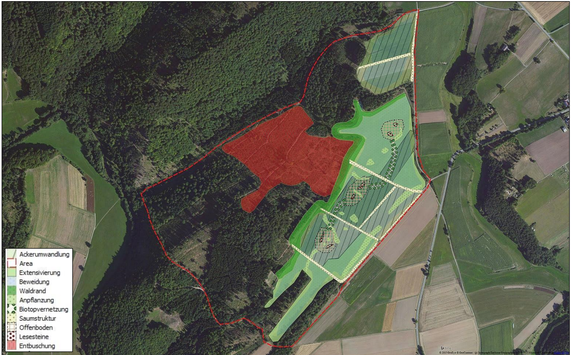
Abbildung 7: Darstellung der Maßnahmenplanung.