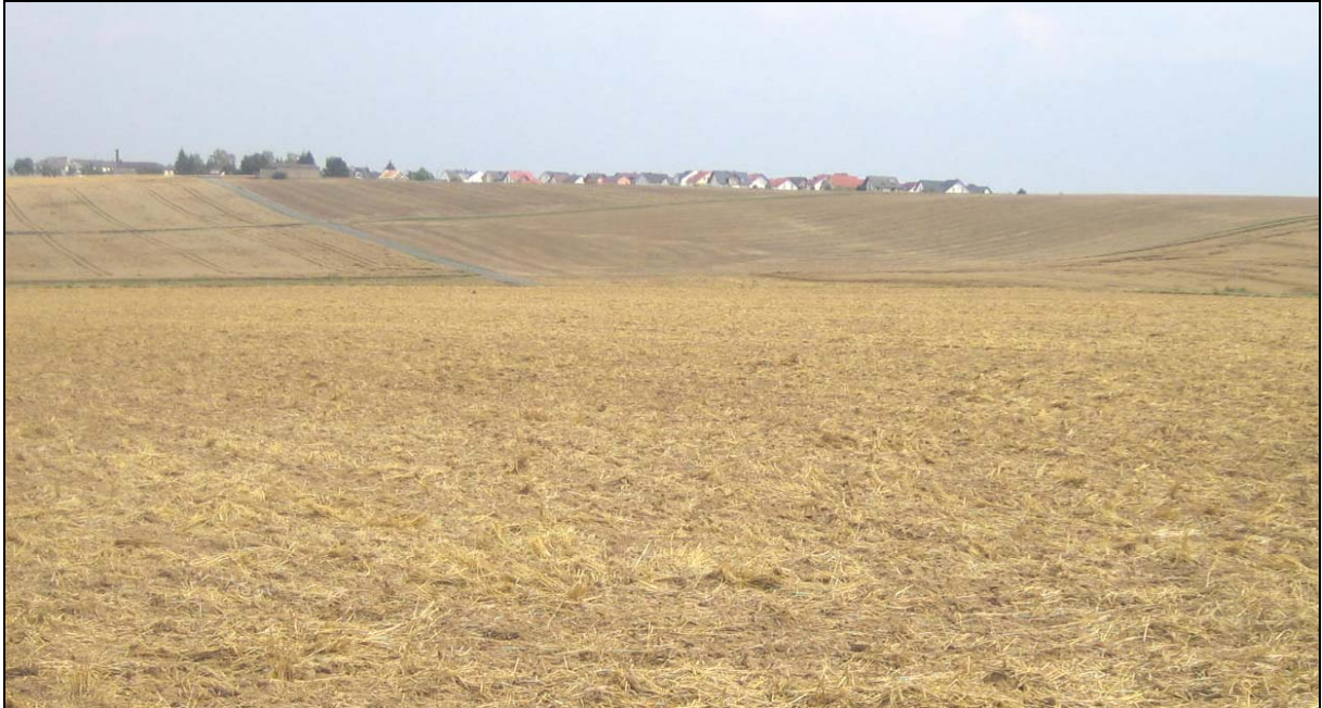
Bild 3 zeigt - nahezu vom selben Standort wie bei Bild 2 - den Blick in die andere Richtung. An der Ortsrändern – hier Eschhofen – hat sich vielfach eine Nebenerwerbslandwirtschaft erhalten, die strukturreiche Ackerlandschaften bewahrt. Diese Gebiete sind jedoch offenbar zu isoliert – und vielfach weisen sie auch schlechtere Böden und einen hohen Feinddruck (Hauskatze) auf – als dass sich der Hamster hier hätte halten können.

Bild 2: So sieht es in der Nacherntephase zwischen Eschhofen und Lindenholzhausen aus. Kartierungen waren hier von vornherein aussichtslos.