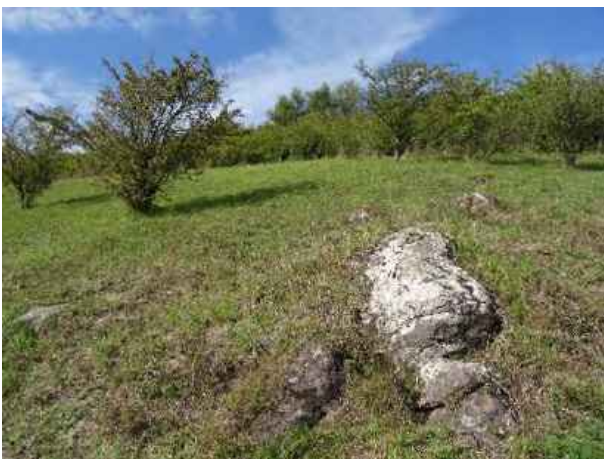
Abb. 3: Lebensraum der Westlichen Smaragdeidechse in Hessen.

Biologie: Die Aktivität der Westlichen Smaragdeidechse reicht je nach Temperaturverlauf von etwa März bis Oktober. Das Sonnen nimmt bei der wärmebedürftigen Art einen großen Teil der Tagesaktivitäten ein. Zum Nahrungserwerb jagen Smaragdeidechsen Insekten, Spinnen, Asseln, Schnecken und kleinere Wirbeltiere. Während des Tages entfernen sich die Tiere meist zwischen 10 und 20 m von ihrem Versteck, die Distanz kann aber auch bis zu 100 m betragen. Die Hauptpaarungszeit liegt im Mai, die Phase der Eiablage schwerpunktmäßig Mitte Juni. Dabei werden etwa vier bis 18 Eier in ein grabbares Substrat mit guten Drainageeigenschaften gelegt. Der Schlupf der Jungtiere findet über einen größeren Zeitraum von August bis Oktober statt. Als Verstecke werden selbstgegrabene Höhlen, Kleinsäugerbauten, Gesteinsspalten, ausgefaulte Stubben oder Asthaufen aufgesucht. Im Winter ziehen sich die Tiere in tiefergelegene Bodenschichten zurück. Prädatoren der Westlichen Smaragdeidechse dürften in den hessischen Lebensräumen vor allem Schlingnatter, Turmfalke, Mäusebussard, Rabenvogel, Hauskatze sowie zahlreiche weitere Arten sein.