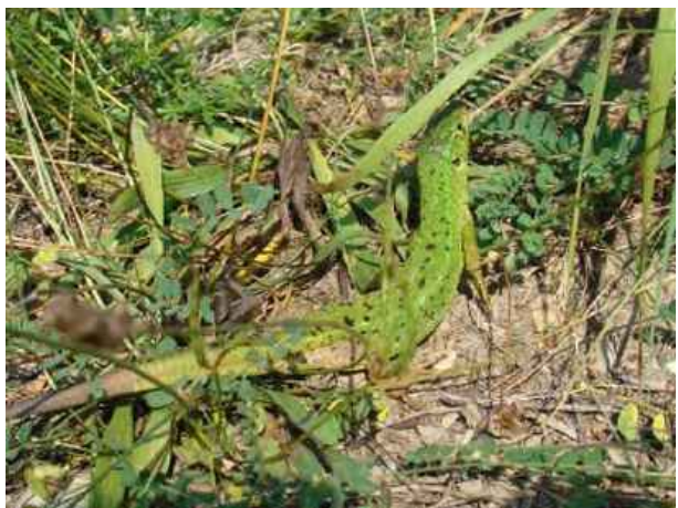
Abb. 4: Weibchen der Westlichen Smaragdeidechse.

Ökologie: Primärlebensräume der Art waren in erster Linie offene sonnenexponierte gerölldurchsetzte Flusstäler. Auch jetzt ist sie am Nordrand ihres Areals in Deutschland in ihrer Verbreitung auf wärmebegünstigte, süd-/südwest-/südostexponierte Hanglagen mit