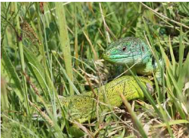
Abb. 1: Männchen (rechts) und Weibchen der Westlichen Smaragdeidechse.