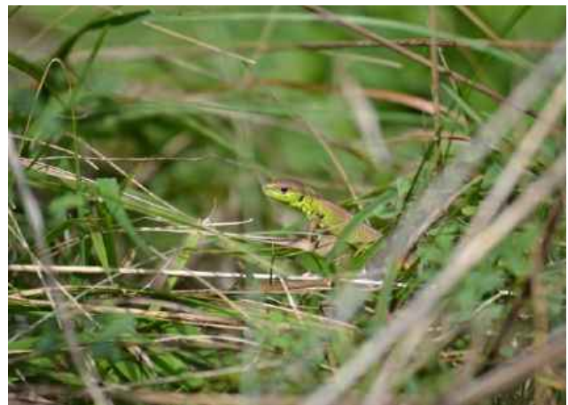
Abb. 2: Jungtier der Westlichen Smaragdeidechse.