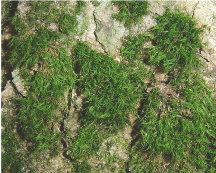
Abb. 1. Dicranum viride (NSG Schwarzwald, Rhön)