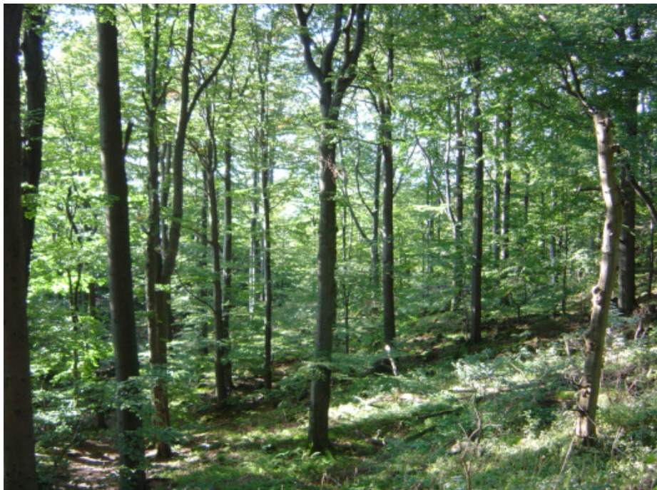
Abb. 2. Dicranum viride wächst in alten, naturnahen und wenig gestörten Laubwäldern (NSG Milseburg, Rhön)