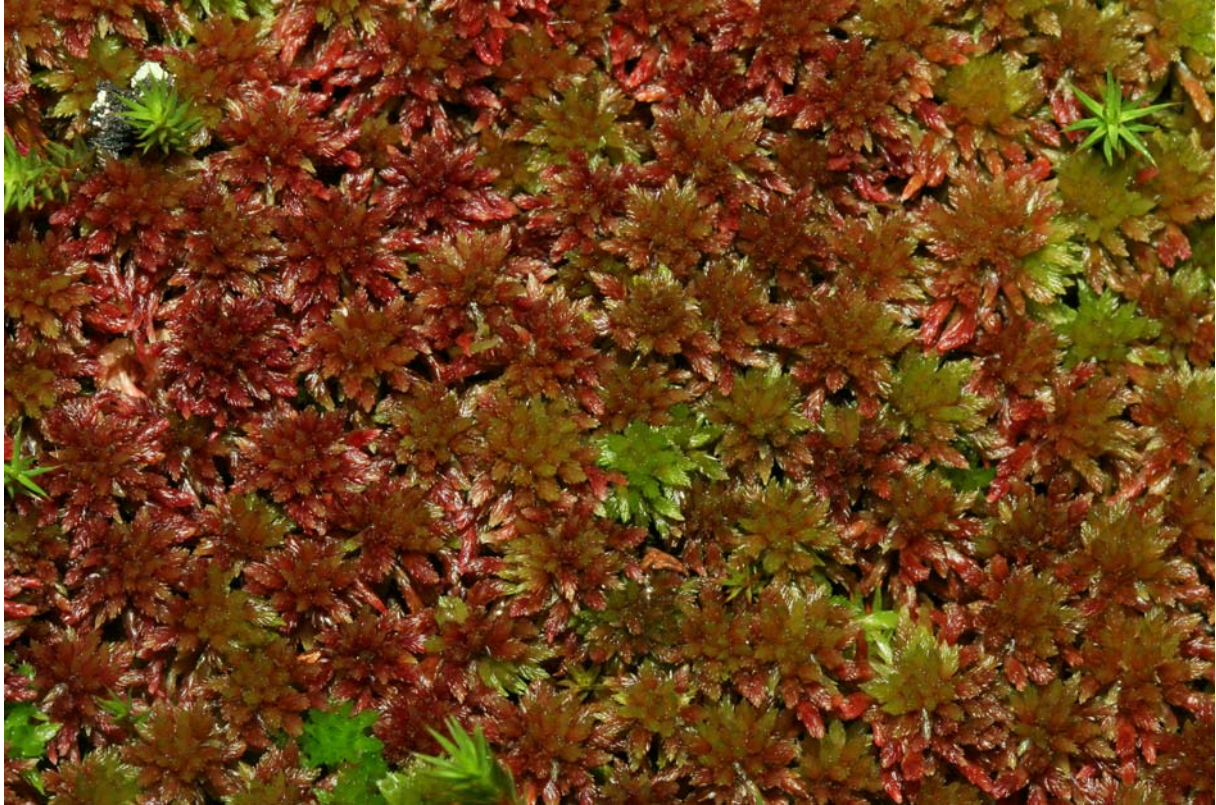
Abb. 1. Sphagnum capillifolium

Erstellt von U. Drehwald, D. Teuber & T. Wolf (2010)