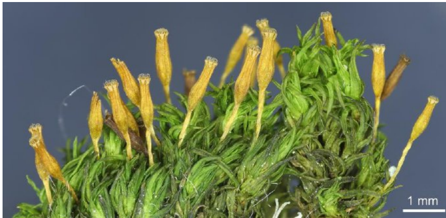
Abb. 1. Orthotrichum consimile aus der Habitatfläche bei Eschenstruth (0048).

Ulota corarctata galt in Hessen lange als verschollen (DREHWALD 2013). Im Naturschutzgebiet „Termenei bei Wilhelmshausen“ wuchs ein Polster am Stamm einer Zitterpappel. Die Art war früher in ganz Deutschland zerstreut verbreitet, aber im Laufe des 20. Jahrhunderts stark zurückgegangen und in den meisten Regionen ausgestorben (MEINUNGER & SCHRÖDER 2007). Erst in den letzten Jahren sind wieder leichte Ausbreitungstendenzen zu beobachten (MÜLLER et al. 2011, GRÜNBERG et al. 2014).