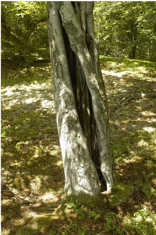
Abb. 3: Larvenhabitat. Krüppelwüchsige Buche mit alter, an den Rändern überwallter Blitzrinne.