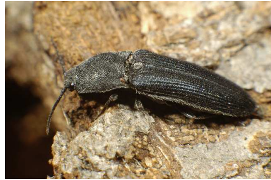
Abb. 2: Limoniscus violaceus (MÜLL., 1821), Käfer