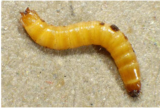
Abb. 1: Limoniscus violaceus (MÜLL., 1821), Larve