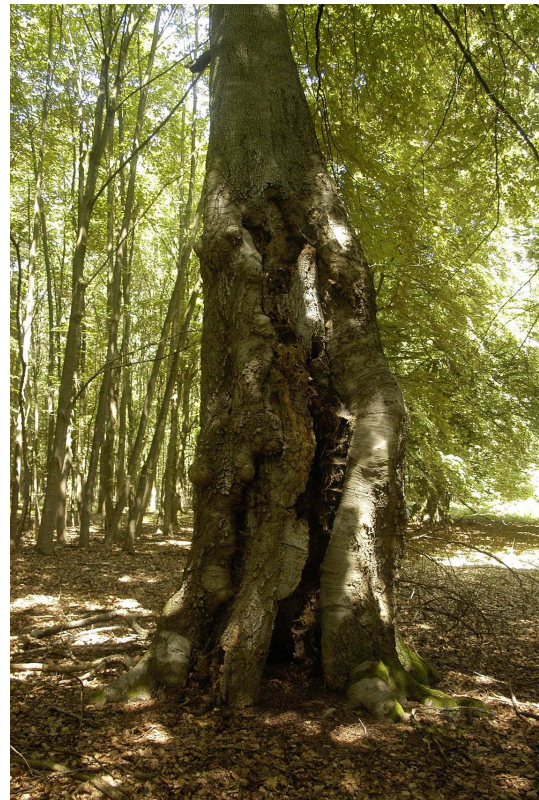
Abb. 4: Larvenhabitat. Die Baumhöhle entstand durch Auseinanderbrechen der Zwiesel-Buche.