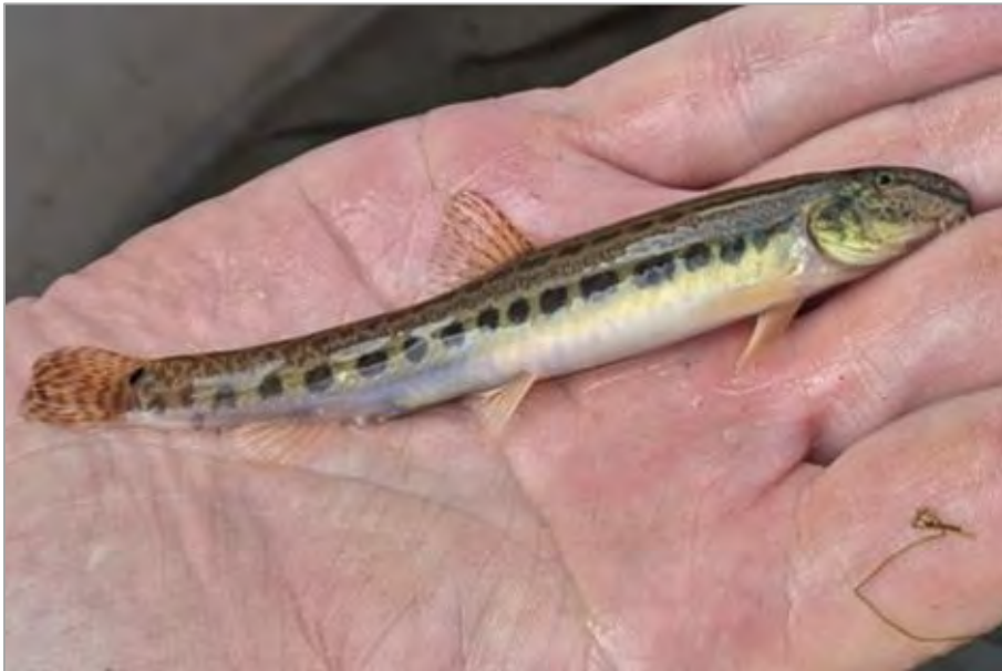
Abb. 1 Adulter Steinbeißer

geringer Strömung < 0,15 m/s anzutreffen (HMUKLV & HESSEN-FORST FENA 2014). Die Art Cobitis taenia erreicht im Freiland ein Alter von bis zu 5 Jahren. Im ersten Jahr erlangen die Tiere eine Totallänge von 40 bis 50 mm, im zweiten 60 bis 68 mm.