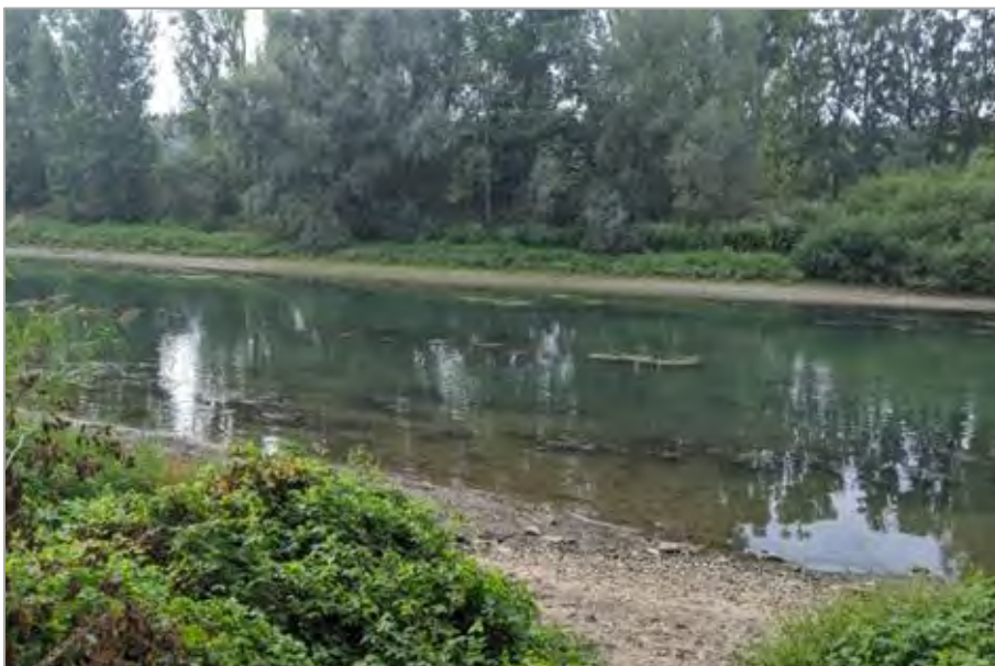
Abb. 2 Typischer Lebensraum am Beispiel des Stockstadt-Erfelder-Altrheins

Die Geschlechtsreife tritt bei Männchen oft schon nach einem Jahr, spätestens nach zwei Jahren ein und bei den größeren Weibchen normalerweise nach zwei Jahren. Steinbeißer laichen von April bis Juni und zeigen eine starke Präferenz für dichte Wasserpflanzenbestände als Laichsubstrat. Pro Saison können die Weibchen ständig neue Eiportionen nachreifen lassen und mehrfach im Abstand von etwa sechs Tagen ablaichen. Steinbeißer durchlaufen die Ei- bis Larvalentwicklung im Schutz von dichter Vegetation und verbringen die Juvenil- und Adultphase überwiegend in Bereichen mit feinen, relativ offenen sandigen Ablagerungen.