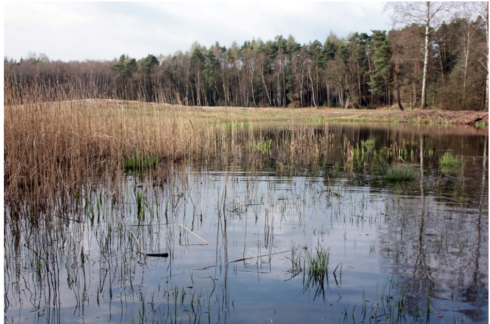
Foto : Probeflä- che Wald östlich von Neu- Isenburg, Wald- tümpel (A. Malten)

Foto : Probeflä- che Wald östlich von Neu- Isenburg, Eirundwiese östl. Gravenbruch (A. Malten)