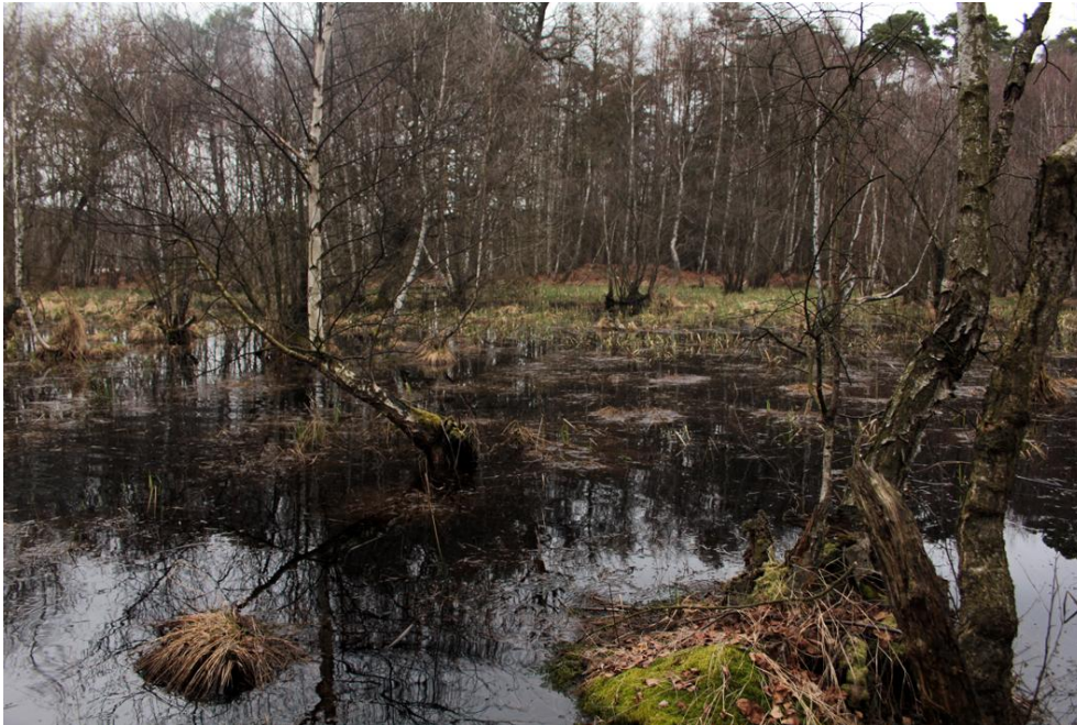
Abb. 5: Bundesstichproben-Monitoringfläche Wald östl. Neu-Isenburg. Hier der Bruch von Gravenbruch.

Die Monitoringfläche ‚Waldgebiet östl. Neu-Isenburg‘ erhält im Berichtszeitraum 2007-2013 in der Gesamtbeurteilung die Stufe B (gut).