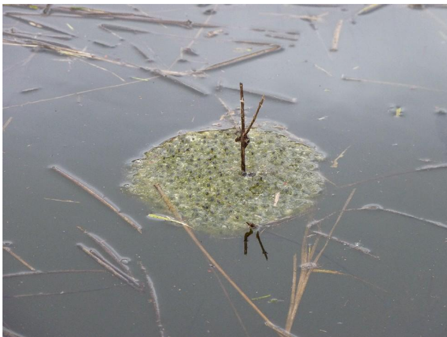
Typischer einzeln abgelegter und angehefteter Laichballen des Springfrosches