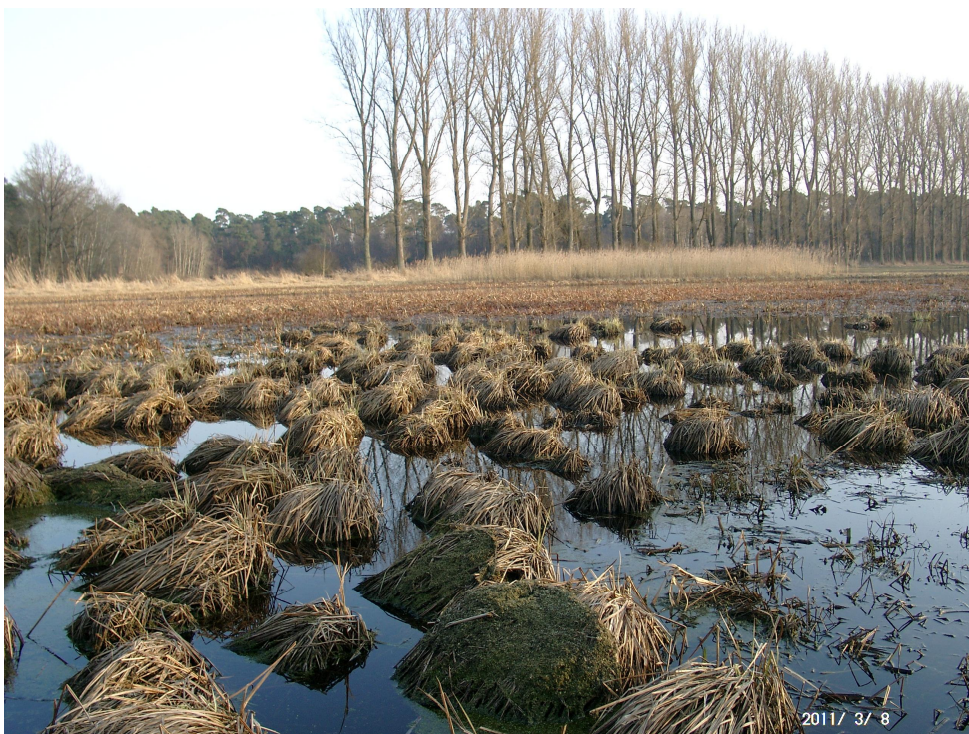
Abb. 2a: Bundesstichproben-Monitoringfläche Brackenbruch, Hauptlaichgewässer (Nr. 5) nordwestlich der Lache am 8.3.2011

Als mittlere Beeinträchtigung ist die extensive Mahd der Wiesenflächen zu nennen („Einsatz schwerer Maschinen“). Die das Gebiet durchquerende Straße hat durch eine Amphibienleitanlage eine geringe Beeinträchtigung. Stärker wirkt die trennende Wirkung der Lache; das Fließgewässer ist als bedingt durchlässig zu bewerten. Eine weitere Beeinträchtigung geht möglicherweise vom Wasserregime aus. Das Gebiet wird über einen Teich mit kaltem Grundwasser gespeist. Es ist davon auszugehen, dass dadurch die Wassertemperaturen im Frühjahr gesenkt sind und die Entwicklung der Kaulquappen damit verzögert werden. Aufgrund der erst im Spätsommer bis Herbst auftretenden Austrocknung der Laichgewässer bleibt dem Springfrosch aber genügend Zeit zur Entwicklung.