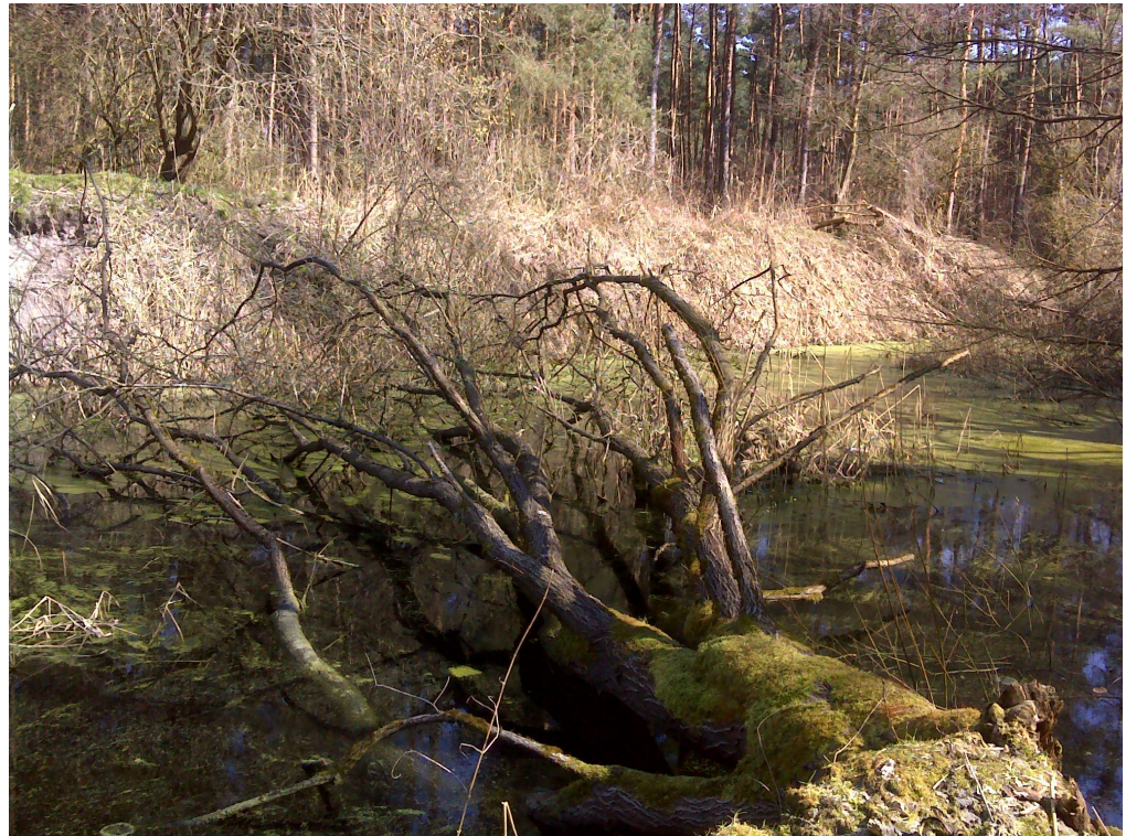
Foto 8: Probefläche Hundsgaben, Gewässer D in der Bachaue. In den Überschwemmungsbecken konnten ca. 30 Laichballen gezählt werden (W. Mathar)

Foto 7: Probefläche Hundsgaben, Gewässer E. Auch hier laichten 200-250 Tiere ab (W. Mathar)