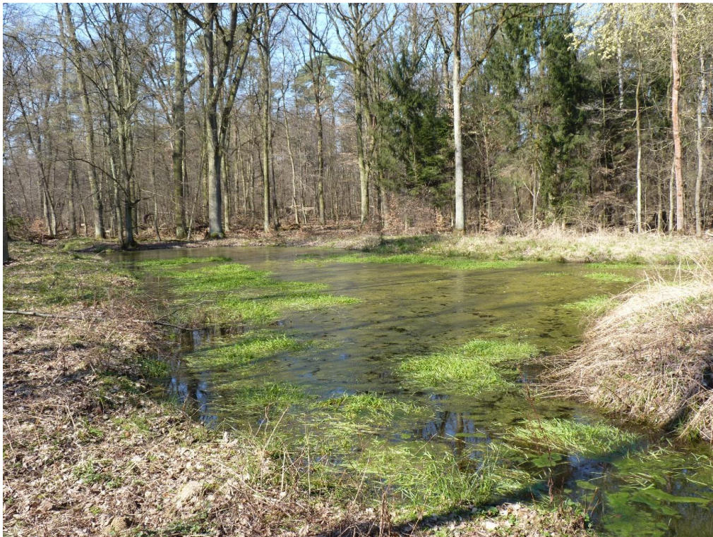
Abb. 3: Bundesstichproben-Monitoringfläche am Hundsgaben, Tümpel A am Oststrand des Habitatkomplexes