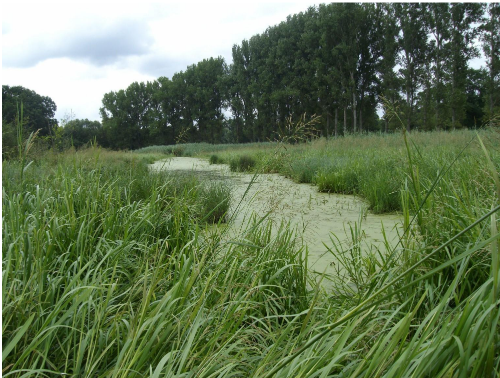
Abb. 2b: Brackenbruch, dasselbe Gewässer Nr. 5 im Sommer 2009, andere Blick- richtung