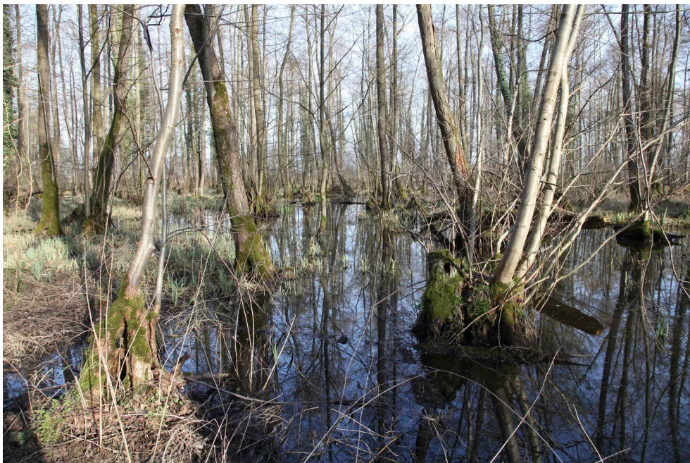
Abb. 4: Bundesstichproben-Monitoringfläche in der Holzlache bei Langwaden.

Die Monitoringfläche ‚Langwaden, Holzlache‘ erhält im Berichtszeitraum 2007-2013 in der Gesamtbewertung die Stufe B (gut).