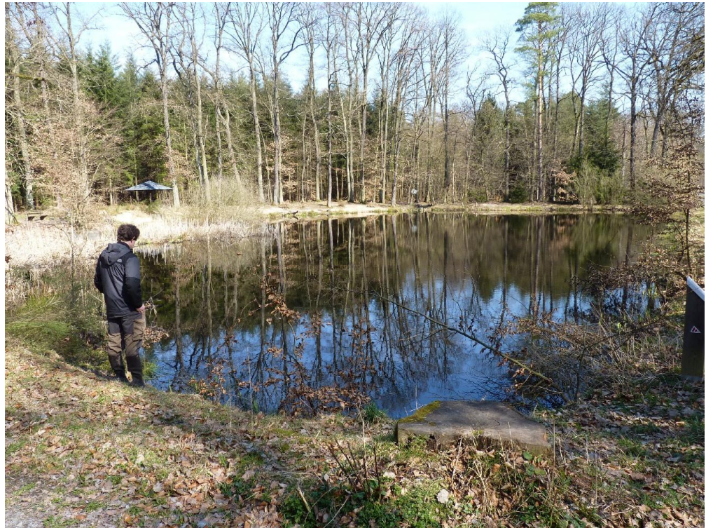
Foto 6: Probefläche Hundsgaben, Gewässer Y. Trotz Fehlen vertikaler Strukturen mit ca. 250 Laichballen (B. Hill)

Foto 6: Lindensee in der Probefläche Hundsgaben. Das größte Einzelgewässer (B) mit 250-275 Laichballen (B. Hill)