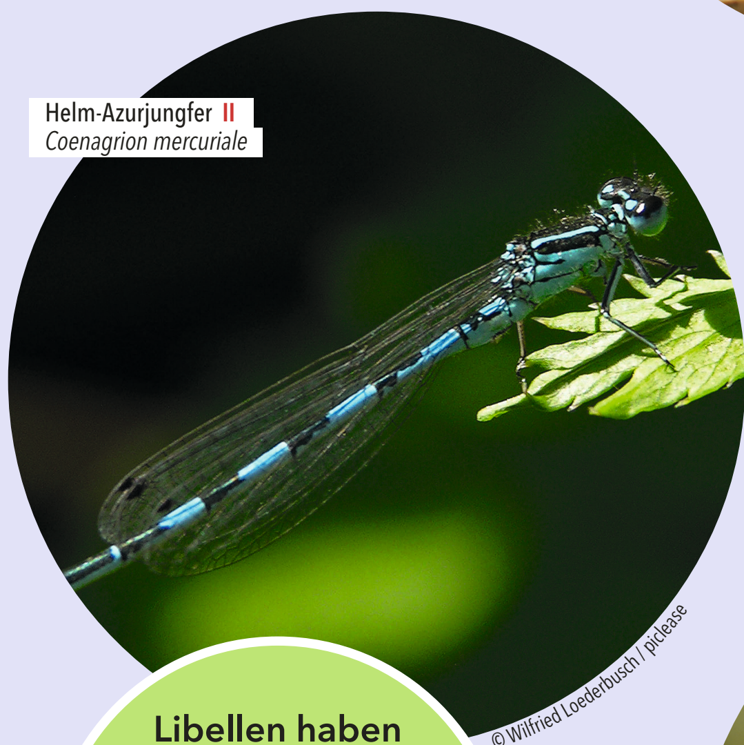
Helm-Azurjungfer II Coenagrion mercuriale