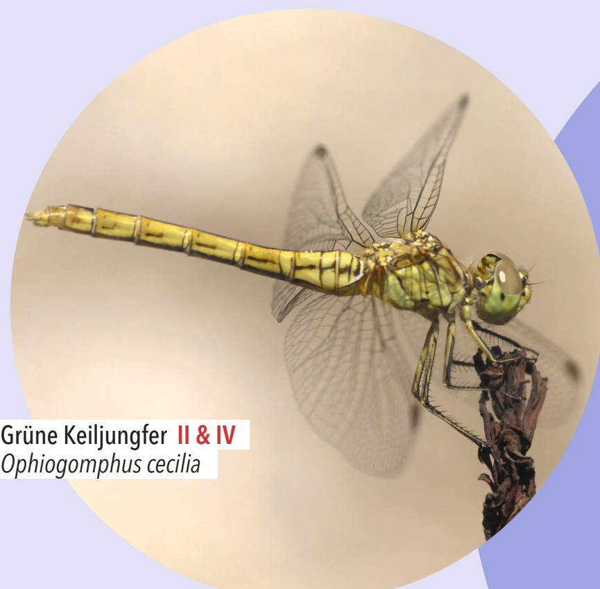
Grüne Keiljungfer II & IV Ophiogomphus cecilia

Die Larven der Großen Moosjungfer leben in der Regel 2-3 Jahre, die erwachsene Libelle lebt nur 2-3 Monate.