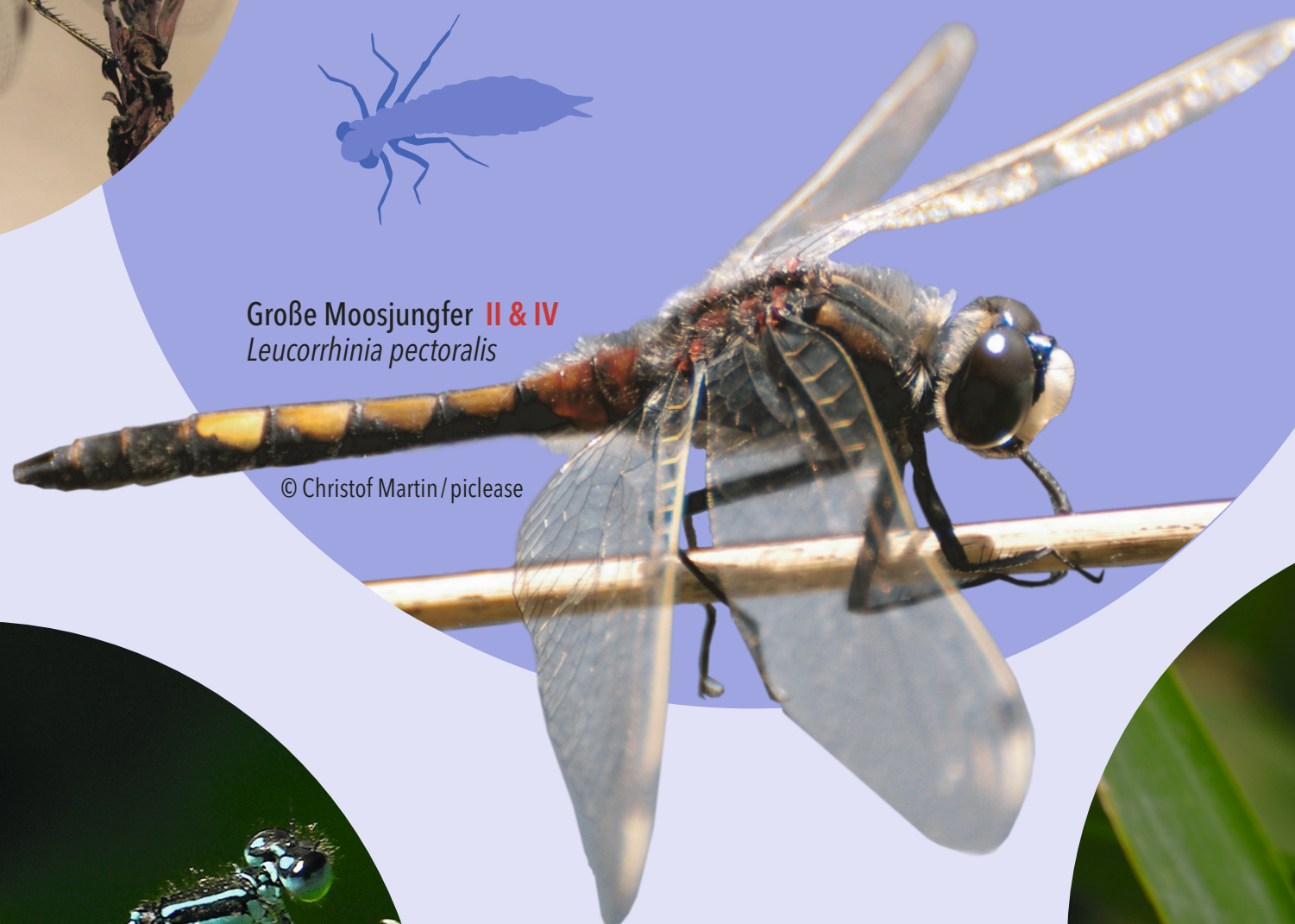
Große Moosjungfer II & IV Leucorrhinia pectoralis