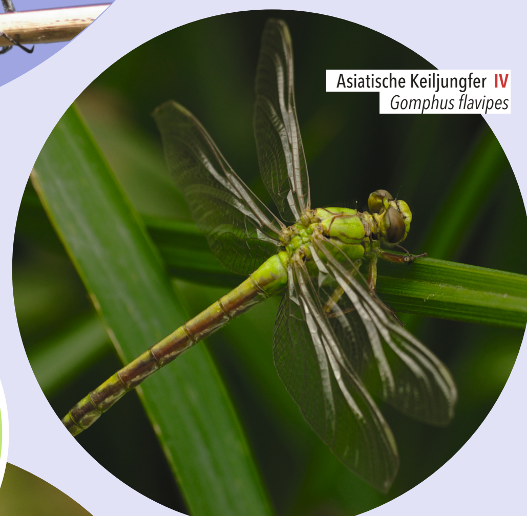
Asiatische Keiljungfer IV Gomphus flavipes