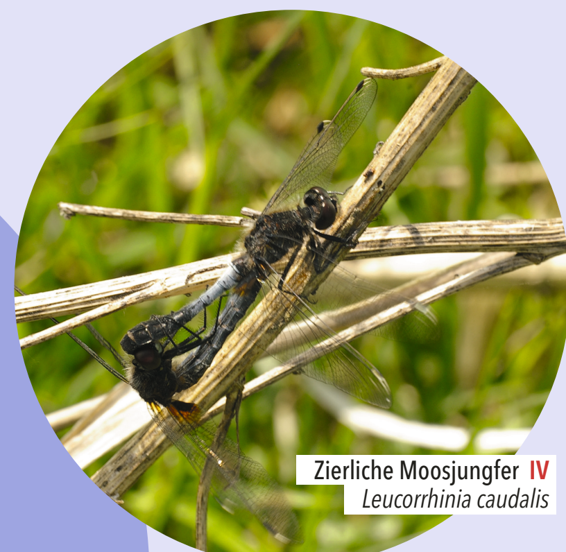
Zierliche Moosjungfer IV Leucorrhinia caudalis