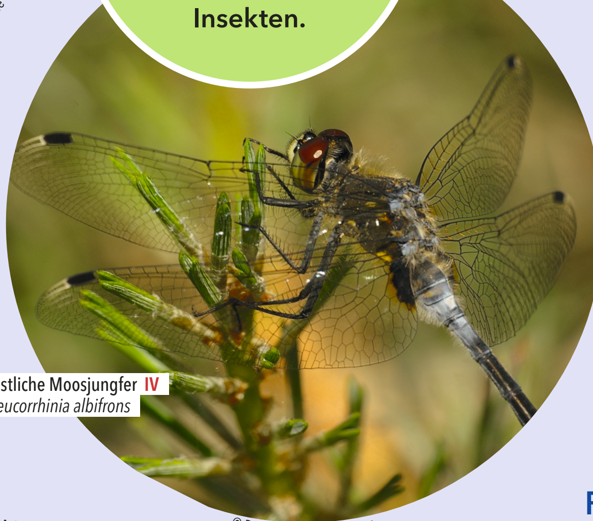
Östliche Moosjungfer IV Leucorrhinia albifrons

Libellen haben 4 Flügel, in zwei unabhängigen steuer- baren Paaren. Dadurch können sie extrem wendig manövrieren, und sogar in der Luft "stehen".