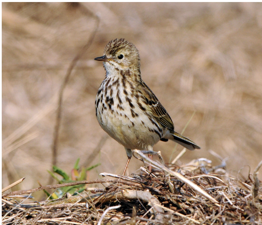
Abb. 11: Die intensive Grünlandnutzung gefährdet den Wiesenpieper ( Anthus pratensis ) stark. Aktuell gehört er zu den Arten, die vom Aussterben bedroht sind.

Ähnlich ist die Situation der Arten, die in Hessen eine besondere Bindung an Streuobstlebensräume aufweisen und deren Überleben direkt an den Erhalt und die Wiederherstellung von Streuobstbiotopen geknüpft ist. Zu den Streuobstcha-