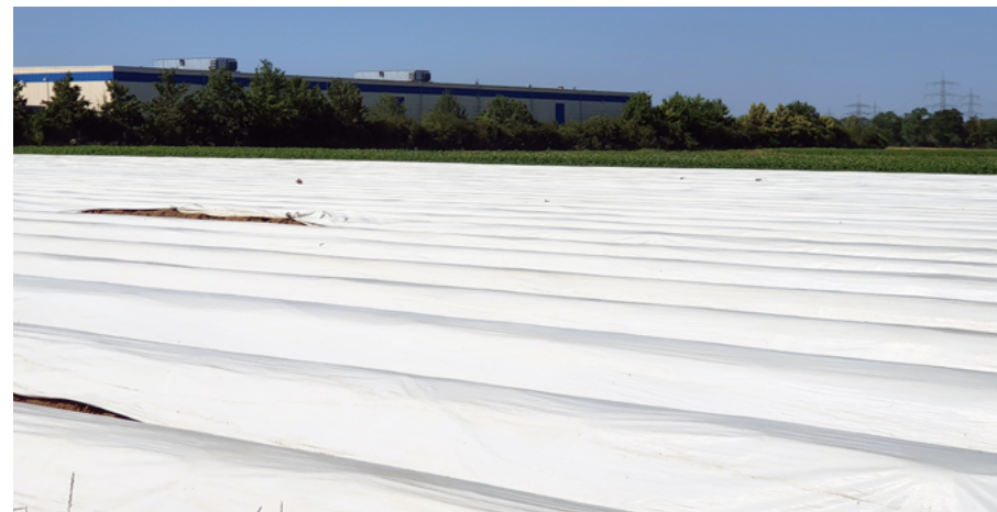
Abb. 10: Mit Folien überspannte Flächen können von Offenlandvogelarten wie der Feldlerche nicht mehr als Brut- oder Nahrungshabitat genutzt werden

In Kombination mit dem konstant hohen Stickstoffüberschuss der landwirtschaftlich genutzten Fläche hat der Landnutzungswandel dazu geführt, dass der Teilindikator „Agrarland“, der in den Indikator für Artenvielfalt der Hessischen Nachhaltigkeitsstrategie eingeht, den für 2020 gesetzten Zielwert noch immer deutlich verfehlt, so dass zum Schutz der Artenvielfalt im Agrarland weiterhin erhebliche und zeitnahe Anstrengungen erforderlich sind (Hessisches Statistisches Landesamt 2022). Vor allem in Südhessen führt die wachsende Verwendung von Folien zu Konflikten mit im Offenland brütenden Vogelarten. Die Situation für Feldvogelarten wie Rebhuhn, Grauammer, Haubenlerche, Wachtel, Feldlerche und Co. hat sich im Bewertungszeitraum dramatisch zugespitzt. Standen Feldlerche und Wachtel zuletzt noch zur Beobachtung auf der Vorwarnliste, haben die fortschreitenden Bestandsverschlechterungen dazu geführt, dass die beiden Arten jetzt als gefährdet eingestuft werden müssen. Für Rebhuhn, Grauammer und Haubenlerche liegen