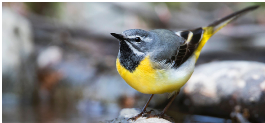
Abb. 6: Die Gebirgsstelze ( Motacilla cinerea ) war zuvor als ungefährdet eingestuft. Durch ihre Bestandsabnahme wird sie nun als gefährdet eingestuft.