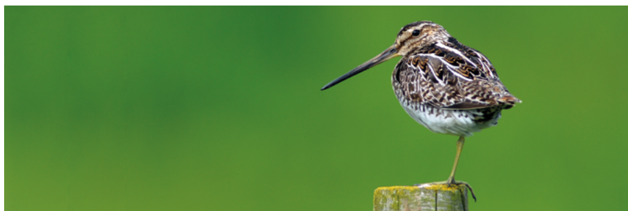
Abb. 4: Die Bekassine ( Gallinago gallinago ) gehört zu den Brutvogelarten in Hessen, die vom Aussterben bedroht sind