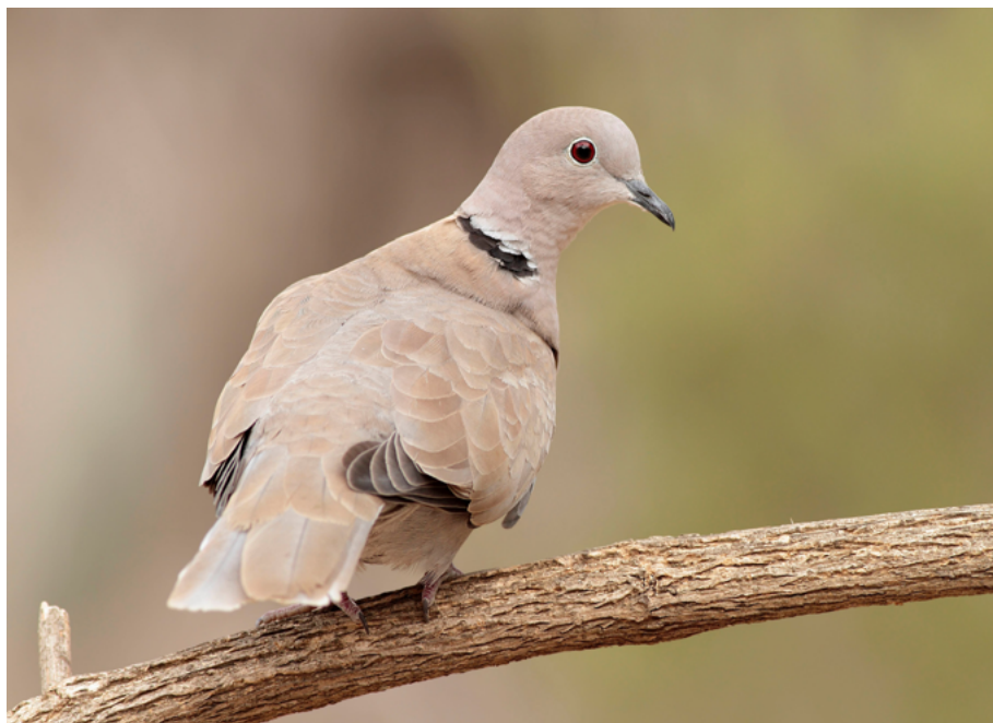
Abb. 13: Die Türkentaube ( Streptopelia decaocto ) bewohnt Gebiete mit dörflichen Strukturen und Kleinviehhaltung. Bislang wurde sie als ungefährdet eingestuft, aber wegen des starken Bestandsrückgangs aktuell als stark gefährdete Art geführt.

Besondere Gefahren bringen neue verglaste Bauwerke mit sich. Glas ist einer der beliebtesten Baustoffe der heutigen Architektur. Mit der Entstehung von neuen Bauwerken steigt die Gefährdung des Glasschlags im Siedlungsbereich stetig. Verspiegelte Glasfronten, durchsichtige Lärmschutzwände und ähnliche Strukturen aus Glas sind für Vögel nicht als solche erkennbar (RÖSSLER et al. 2022). Jährlich sterben weltweit mehrere Millionen Vögel durch den Aufprall an Glasstrukturen (Loss et al. 2014, Länderarbeitsgemeinschaft der Vogelschutzwarten 2017). In den vergangenen Jahren hat sich das Wissen über den Vogelschlag,