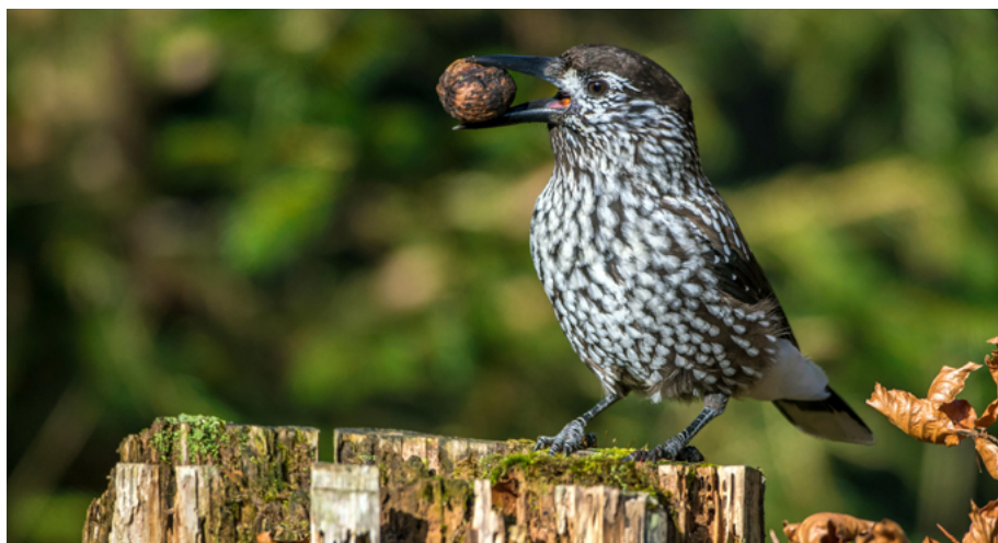
Abb. 12: Der Tannenhäher ( Nucifraga caryocatactes ) war in der letzten Roten Liste noch ungefährdet, doch wird nun als stark gefährdet eingestuft

Unter den Vogelarten mit Waldbezug haben sich fünf Arten in ihrer Gefährdungskategorie verschlechtert und sechs Arten zeigen eine positive Veränderung (Tabelle 16). Das Haselhuhn wird in der aktuellen Roten Liste nun als ausgestorben geführt. Die Ursache für sein Verschwinden liegt vor allem im sukzessiven und flächigen Verlust geeigneter Lebensräume über die letzten Dekaden. Dies beinhaltet auch die Umwandlung der lichten Niederwälder in Fichten-Hochwälder, was zum Verschwinden traditioneller Nutzungsformen wie z. B. der Haubergswirtschaft führte (VOLLMUTH 2022). Abgesehen vom Haselhuhn sind Veränderungen in den Trends vor allem durch die Klimaveränderung und die extrem trockenen Hitzesommer zu erklären. Dies führte zu einem stetigen Anstieg von Borkenkäferausbrüchen, Windwürfen oder Trockenschäden, (SCHELHAAS et al. 2003, SEIBOLD & THORN 2022). In Hessen zeigen die Ergebnisse der Waldzustandserhebung für die Jahre 2019–2021 die höchsten Anteile an stark geschädigten Bäumen seit 1984 (PAAR & DAMMANN 2021b). Die Rhein-Main-Ebene, in der die Verschlechterung des Kronenzustandes der älteren Bäume bei einem Rekordniveau von 42 % liegt, ist am stärksten betroffen (PAAR & DAMMANN 2021a). Die Trockenperiode 2018–2021 hat zu Rekord-