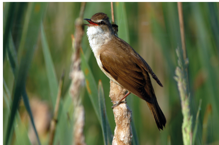
Abb. 5: Der Bestand des Drosselrohrsängers ( Acrocephalus arundinaceus ) ist seit der letzten Roten Liste wieder angestiegen und konnte in die Kategorie „stark gefährdet“ heruntergestuft werden