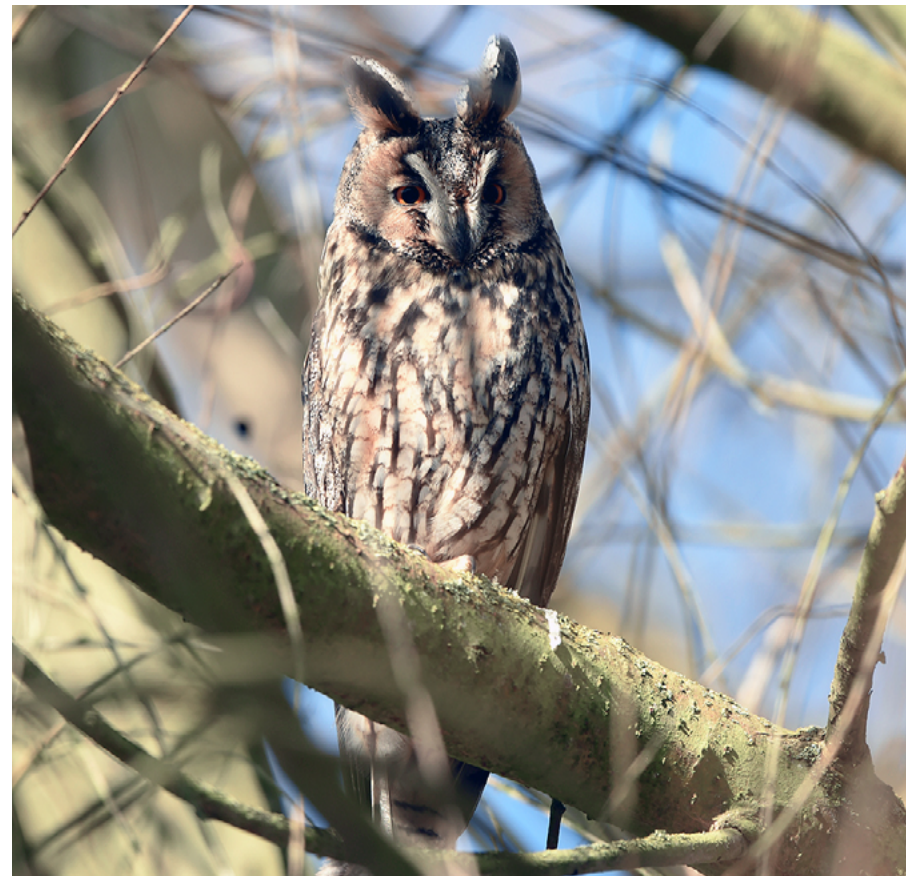
Abb. 1: Die Waldohreule ( Asio otus ) ist deutschlandweit die zweithäufigste Eulenart. In Hessen zählte sie bereits 2014 zu den gefährdeten Arten. Heute ist sie sogar den stark gefährdeten Arten zuzuordnen.

Rote Listen gefährdeter Tier- und Pflanzenarten sind ein bewährtes und anerkanntes Naturschutzinstrument. Zusammen mit den Ampel-Bewertungen zum Erhaltungszustand veranschaulichen sie die Bestandssituation und Gefährdung von Arten. Die letzte Rote Liste der bestandsgefährdeten Vogelarten Hessens stammt aus dem Jahr 2014 (10. Fassung; (WERNER et al. 2014b)).