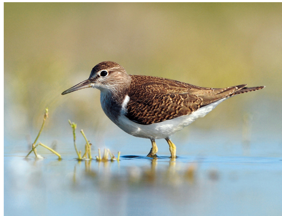
Abb. 3: Der Flussuferläufer ( Actitis hypoleucos ) ist in der RL 2023 neu zu den ausgestorbenen Brutvogelarten in Hessen hinzugekommen