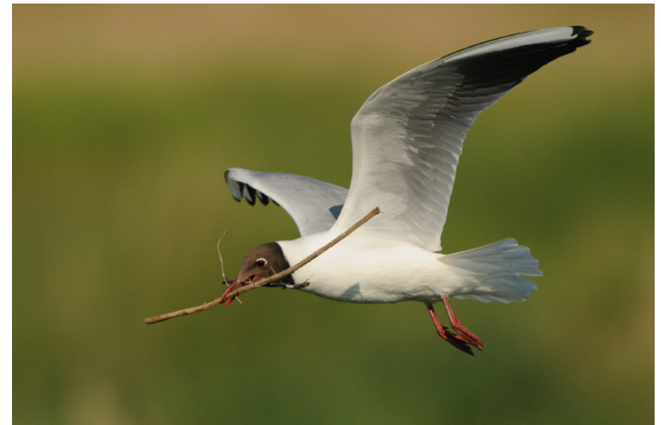
Abb. 7: Die Lachmöwe ( Chroicocephalus ridibundus ) war in den letzten Jahren nur noch im NSG „Rhäden von Obersuhl“ zu finden und wird daher der Kategorie R zugeordnet.