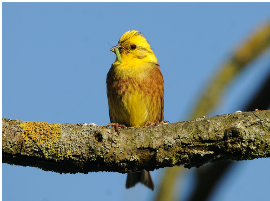
Abb. 8: Die Goldammer ( Emberiza citrinella ) ist eine der Vertreterinnen der Vorwarnliste