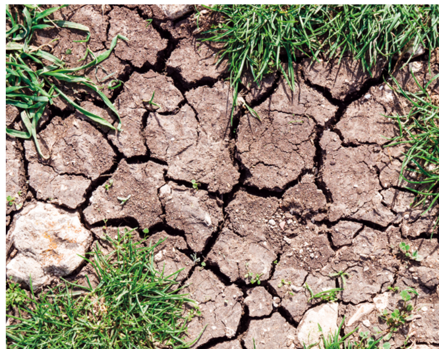
Abb. 2: Durch die zunehmende Trockenheit sind insbesondere die Brutvogelarten der Feucht-lebensräume stark unter Druck

Wenn mit hoher Wahrscheinlichkeit prognostiziert werden kann, dass sich der Bestand einer Art durch bestimmte Einflüsse innerhalb der nächsten 12 Jahre auf Basis der Entwicklung der letzten Jahre drastisch verschlechtern wird, können bzw. müssen Risikofaktoren (RF) geltend gemacht werden (LUDWIG et al. 2009). Die Prognosen einer solchen drastischen Verschlechterung müssen sich hierbei auf valide Quellen stützen. In Hessen wirken sich insbesondere menschliche Einwirkungen auf die Entwicklung einiger Arten aus. Beeinträchtigungen durch Bauvorhaben (bspw. Mauersegler), Ausbau von Windkraftanlagen (bspw. Rotmilan, Wespenbussard) oder die Vergrämung und Jagd (bspw. Saatkrähe, Rebhuhn) werden zukünftig einen starken direkten Einfluss auf den Bestand der Arten haben (RF D). Aber auch die Kontamination und vor allem der durch Menschen beschleunigte Klimawandel (RF I) erhöhen den Druck auf viele Arten insbesondere der Feuchtgebiete (bspw. Zwergtaucher, Rohrweihe). Arten, die ohne Naturschutzmaßnahmen nicht mehr in Hessen zu halten sind, werden mit dem Risikofaktor N (bspw. Uferschwalbe, Steinkauz) belegt. Gemäß Roter Liste der gefährdeten Biotoptypen Deutschlands gehören Streuobstbestände zu den bedrohten Biotoptypen (FINCK et al. 2017). Wegen des damit einhergehenden Verlusts geeigneter Brutplätze, wird für die in Hessen eng an den Lebensraum Streuobst gebundenen Vogelarten (bspw. Gartenrotschwanz, Steinkauz) der Risikofaktor N vergeben.