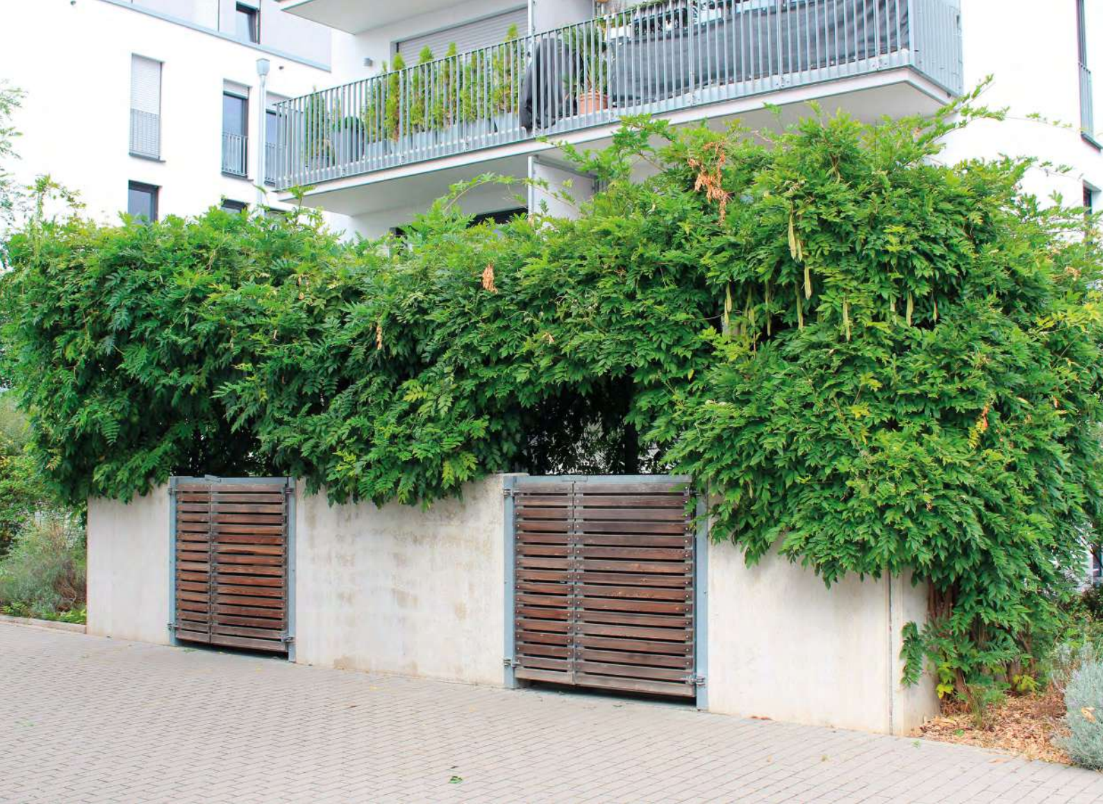
Abb. 7: Standplätze für Mülltonnen kann man einfach aufwerten.