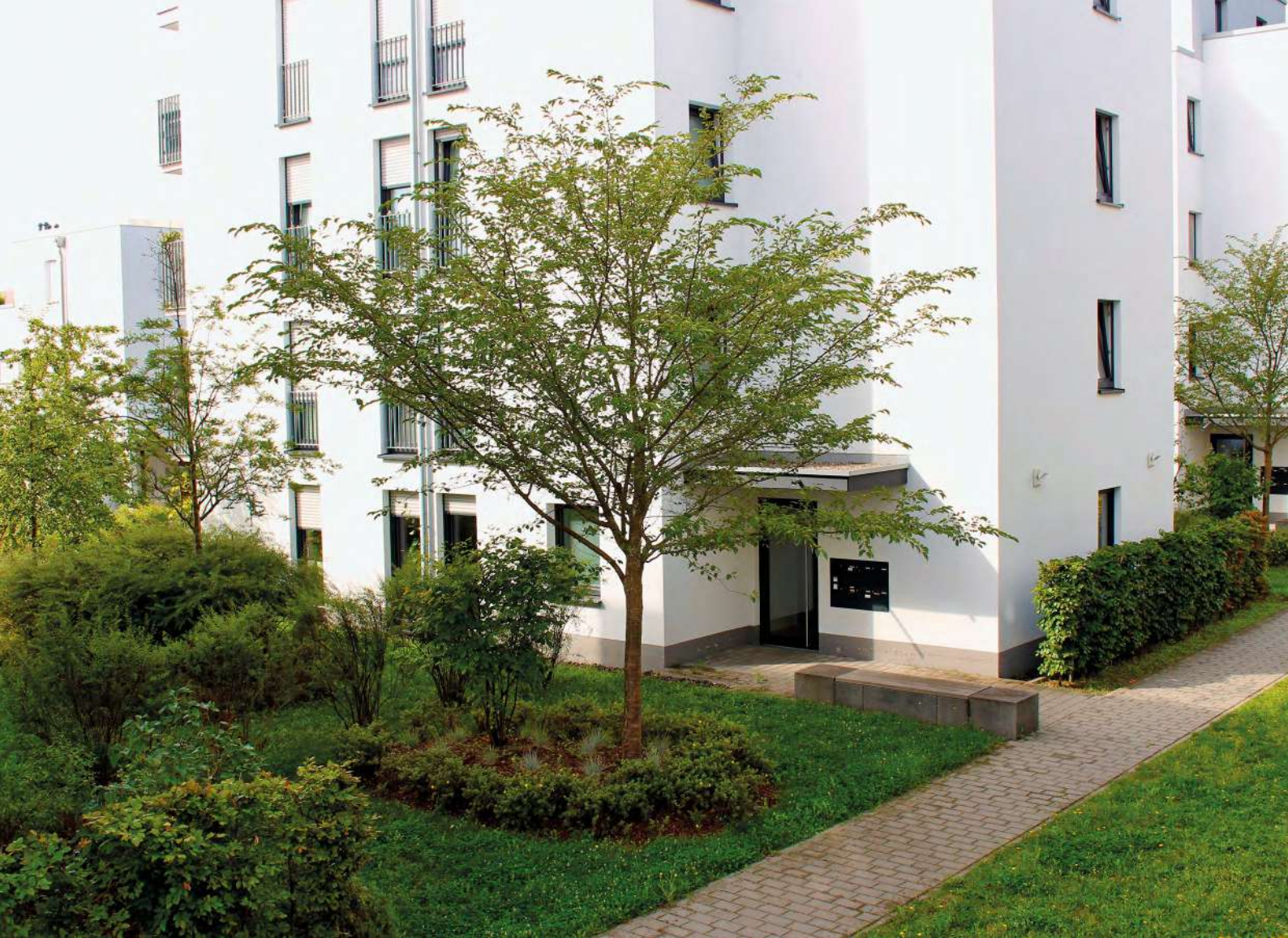
Abb. 3: Bäume/Sträucher verschatten, kühlen und fördern die Artenvielfalt.