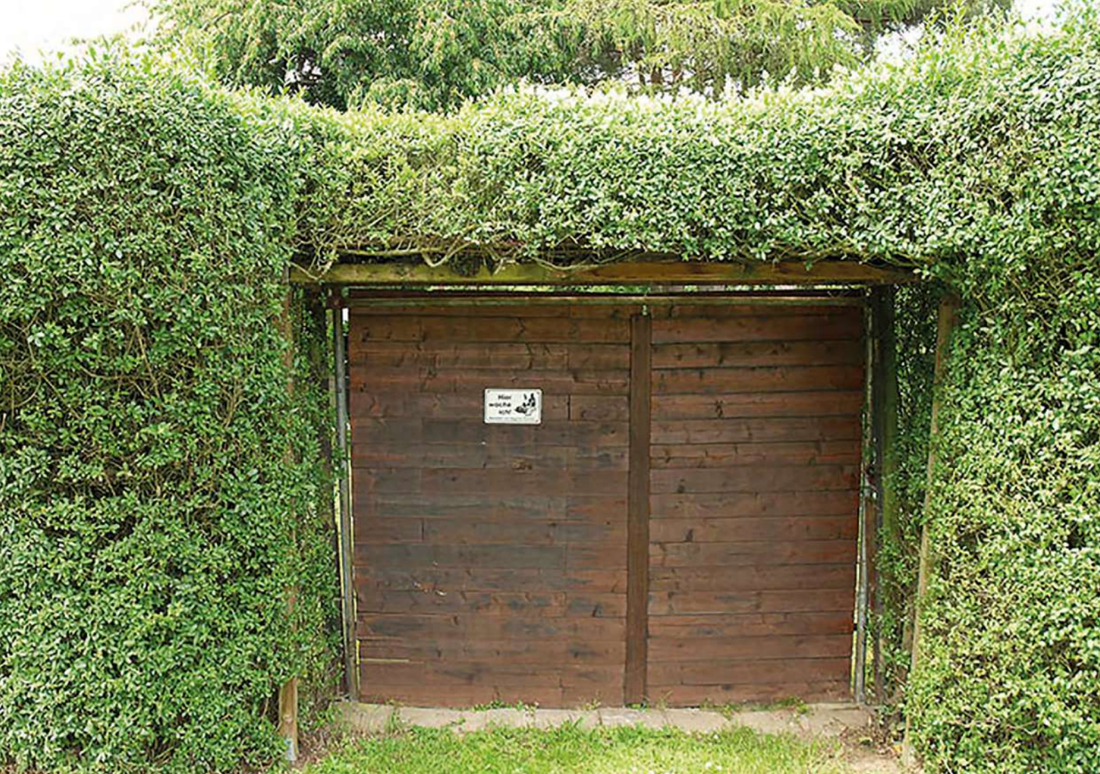
Abb. 9: Natürliche Einfriedungen fördern ein gutes Mikroklima.