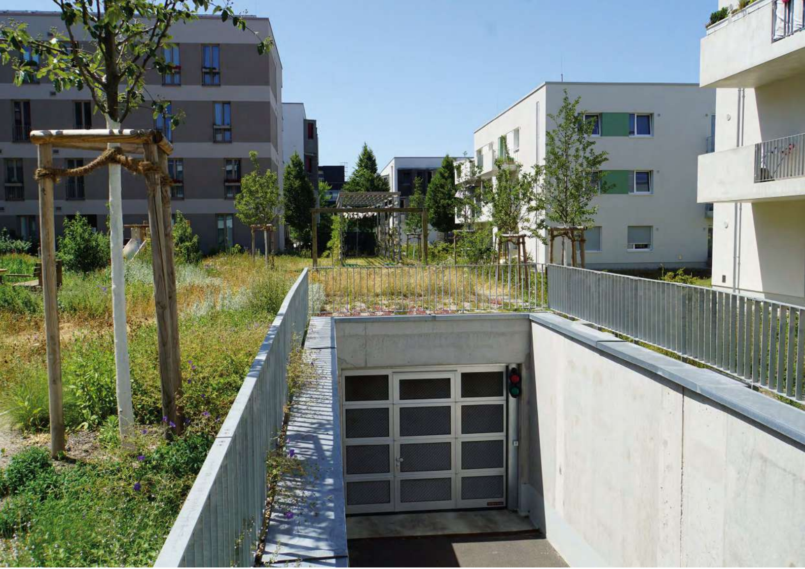
Abb. 17: Dächer von Tiefgaragen können zu Gärten werden.