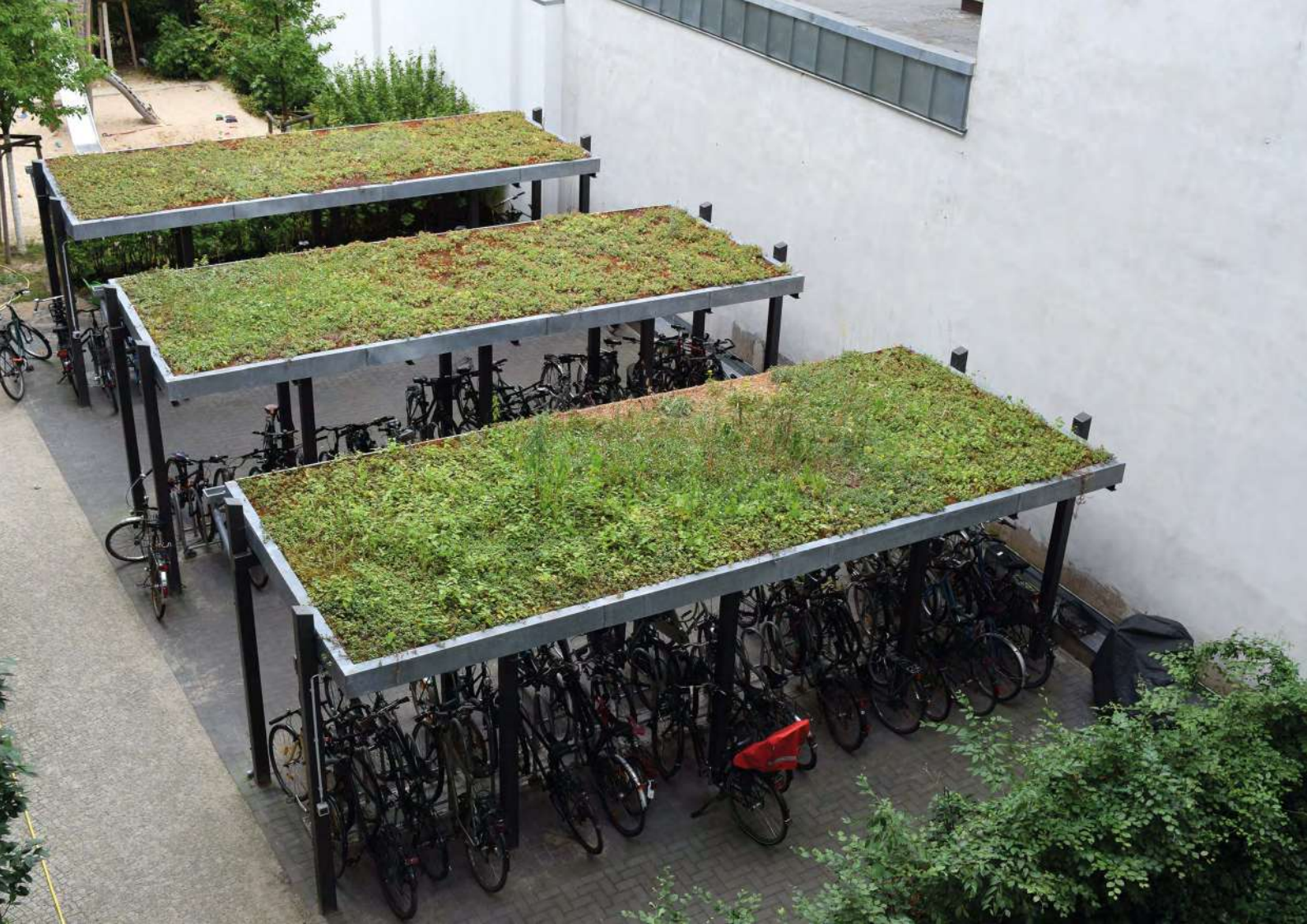
Abb. 15: Dachflächen jeglicher Art können begrünt werden.