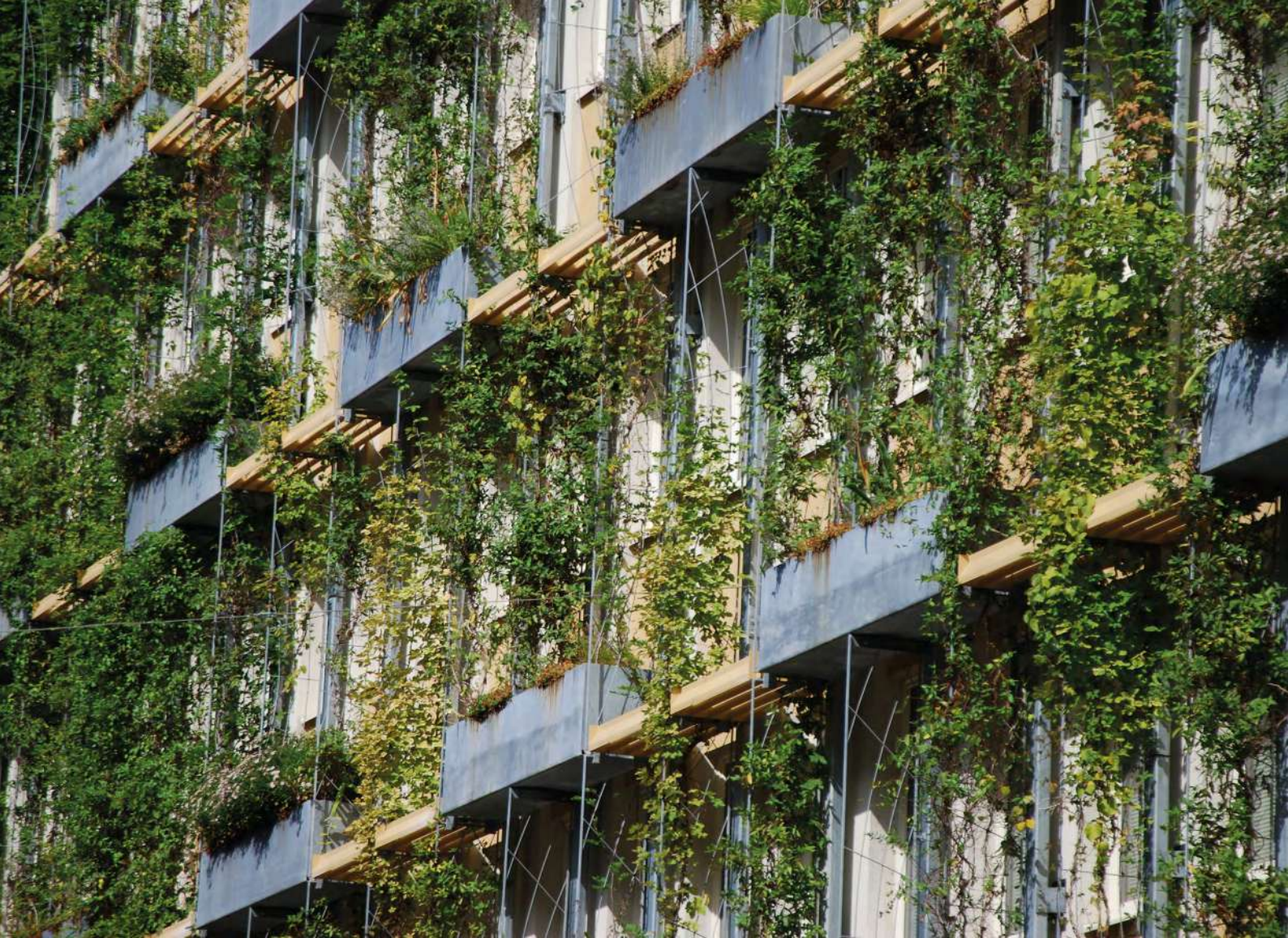
Abb. 11: Fassadenbegrünung kühlt, verschattet und gestaltet.