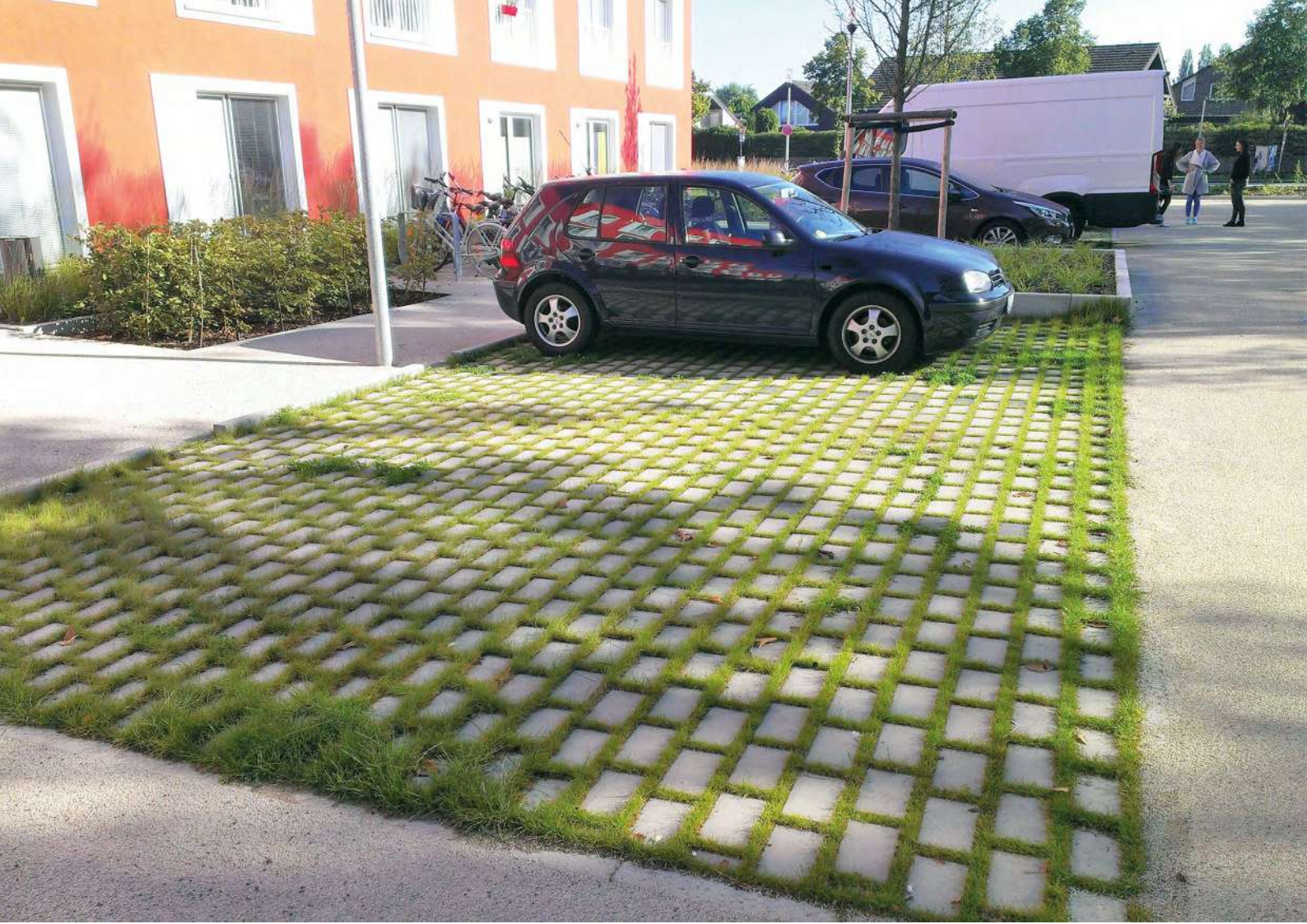
Abb. 14: Auch befestigte Flächen können wasserdurchlässig sein.