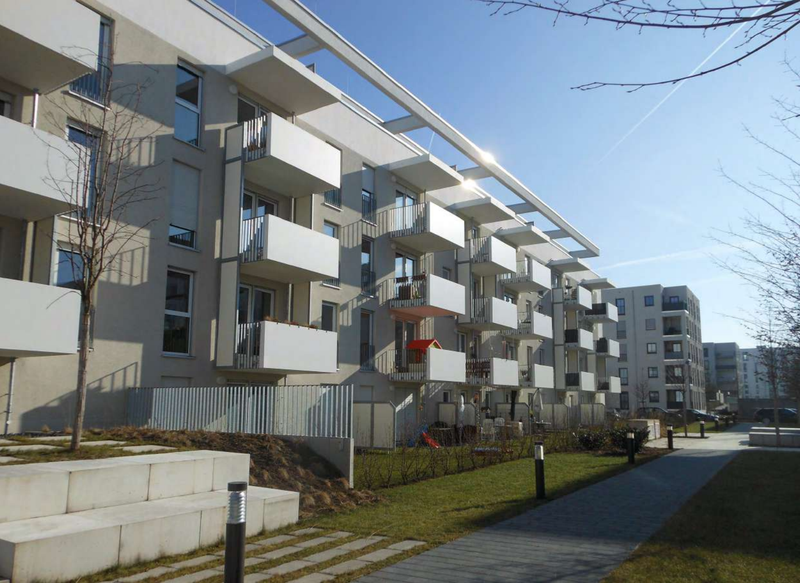
Abb. 12: Helle Farben haben einen hohen Rückstrahleffekt.