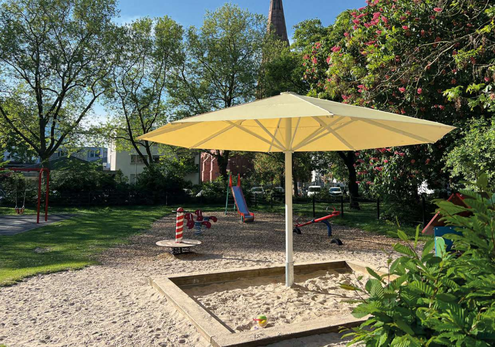
Abb. 6: Kinder müssen vor Sonne geschützt werden.