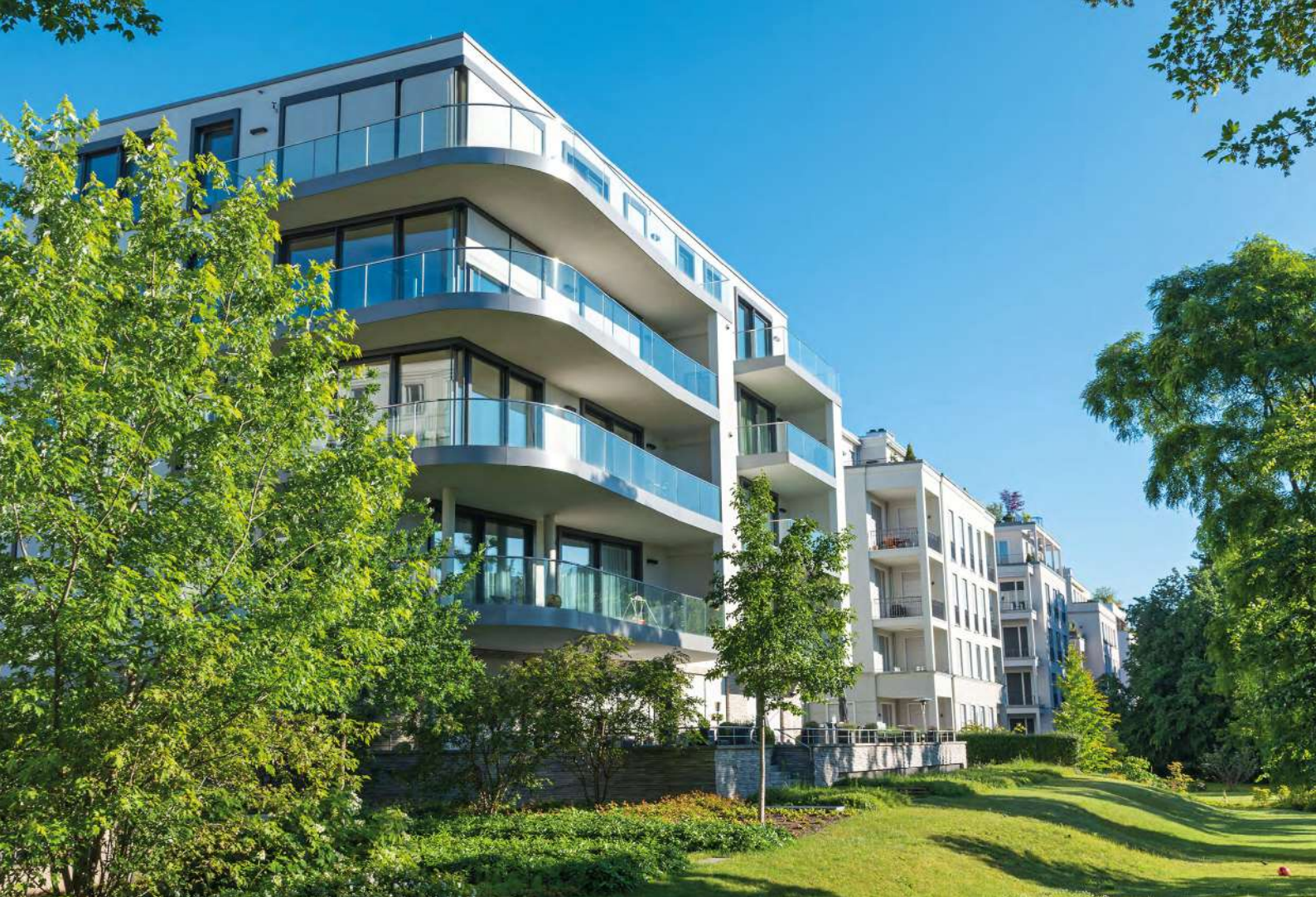
Abb. 2: Begrünte Grundstücksfreiflächen nehmen Wasser auf und kühlen.