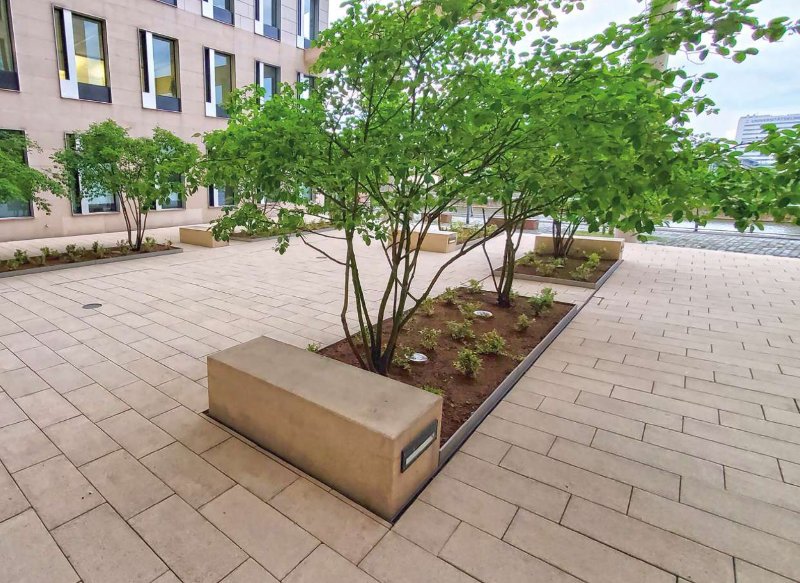
Abb. 5: Helle Oberflächen heizen sich nicht so schnell auf.