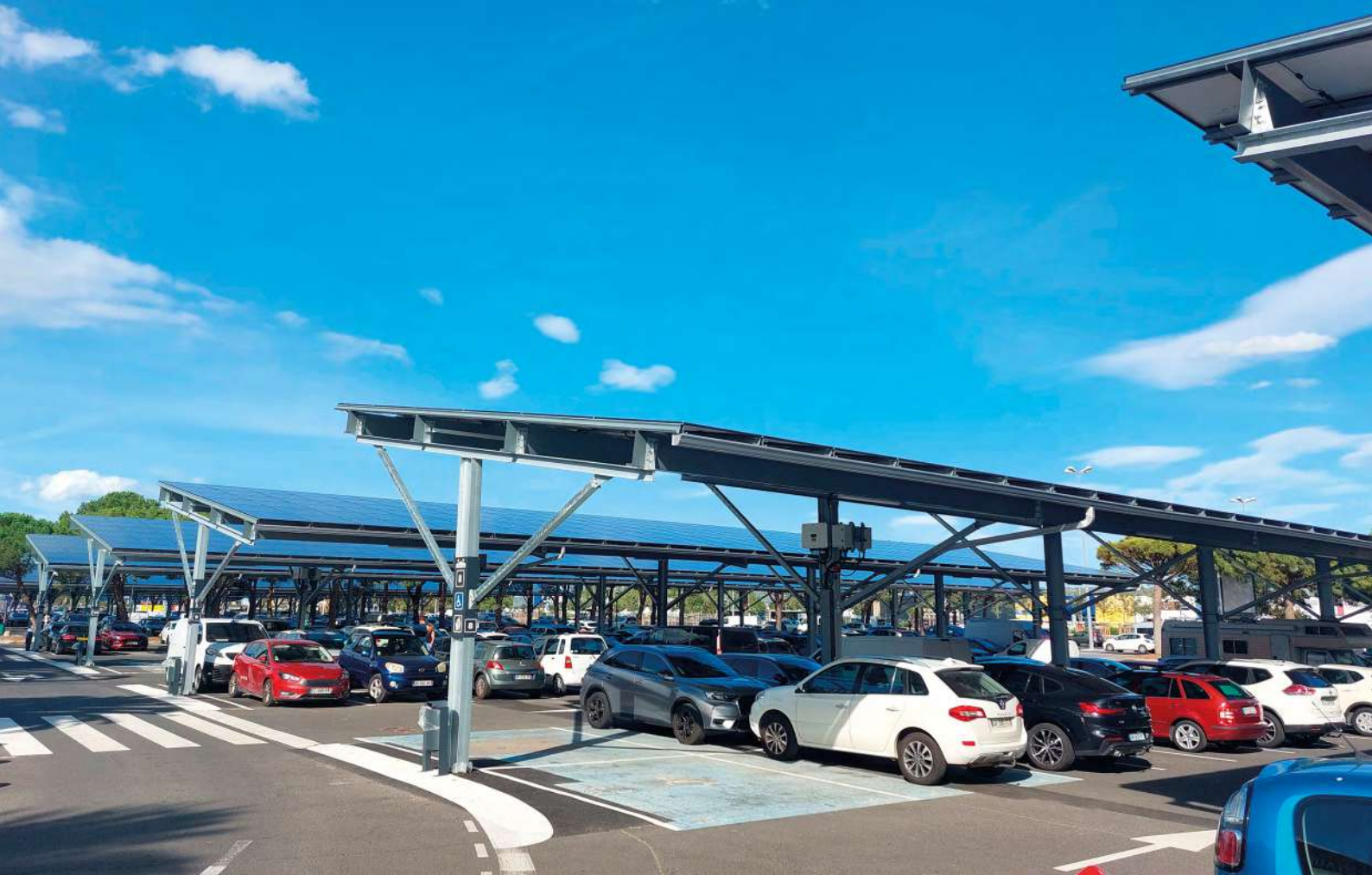
Abb. 13: Hat kein Baum Platz, können auch Solarmodule verschatten.