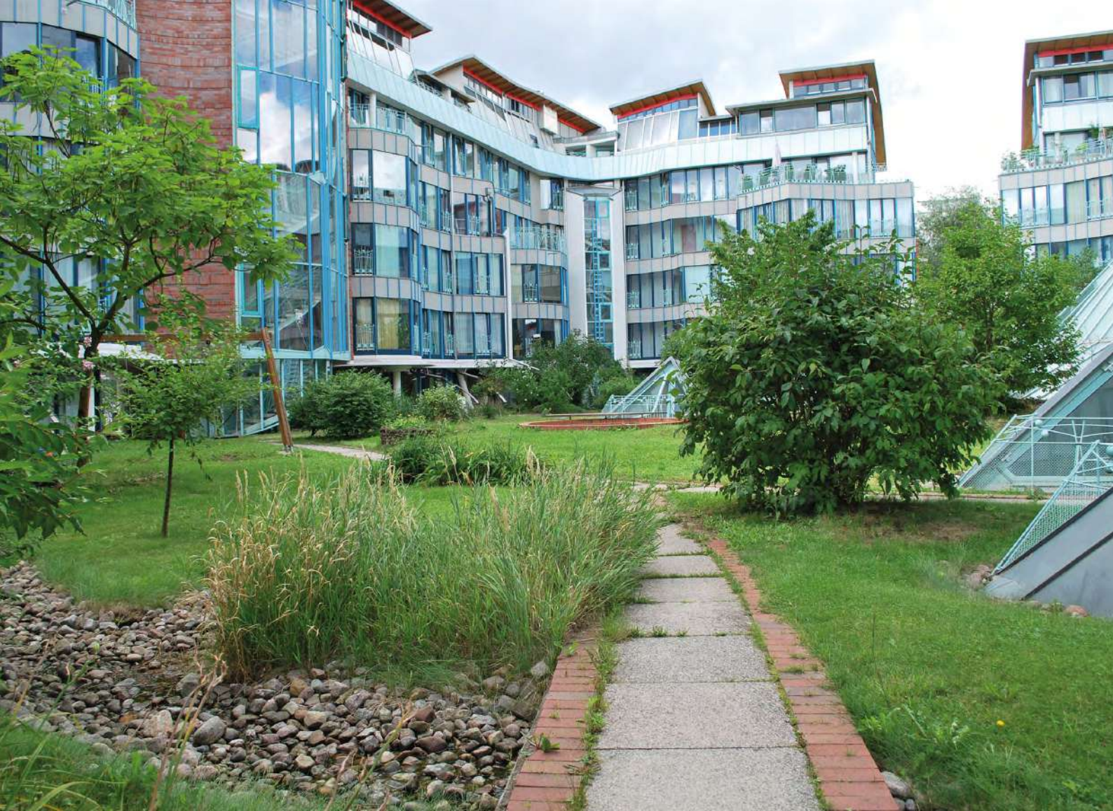
Abb. 4: Regenwasser kann versickern und für Kühlung sorgen.