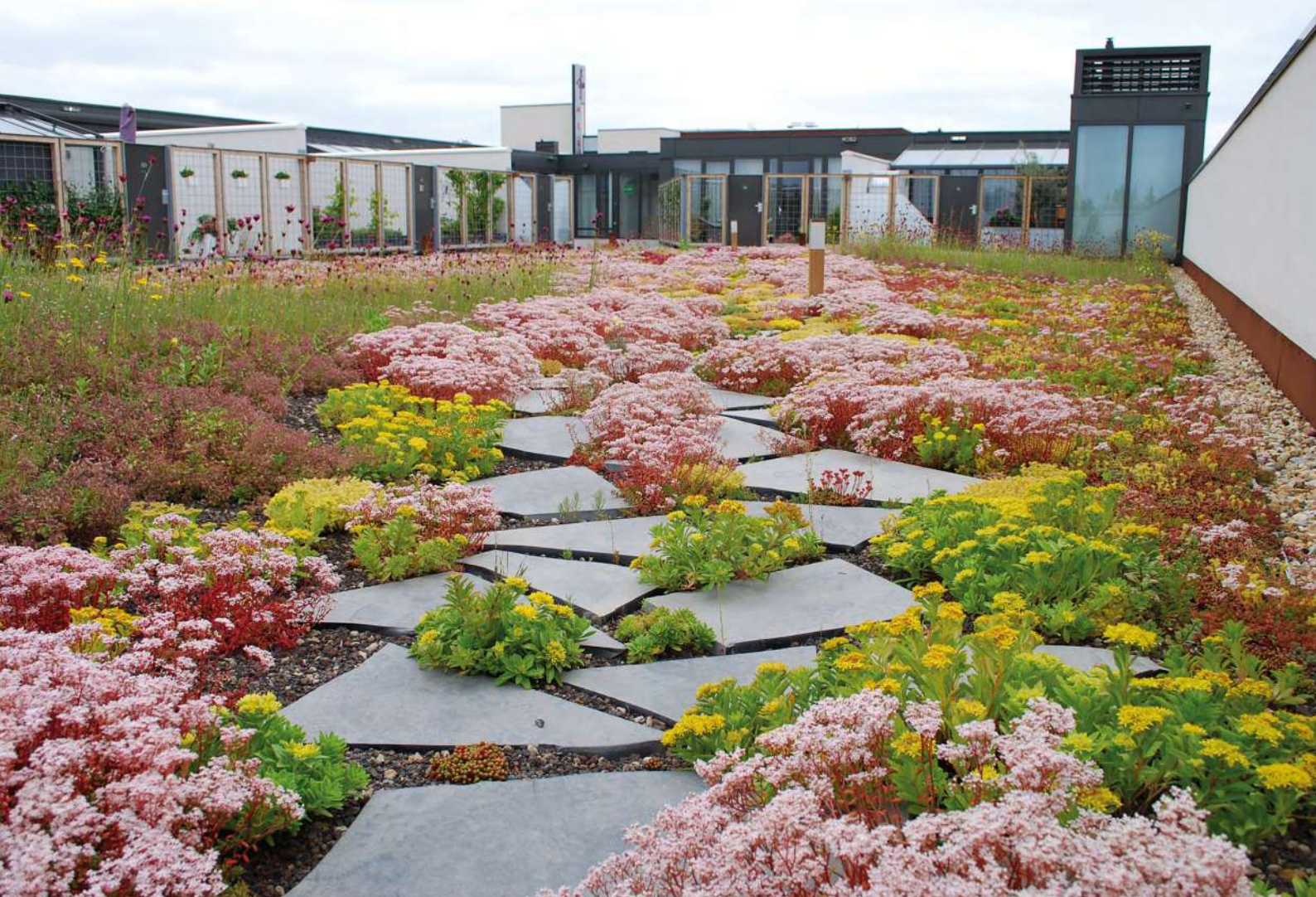
Abb. 10: Von einfacher Begrünung bis üppigem Dachgarten: Alles möglich!