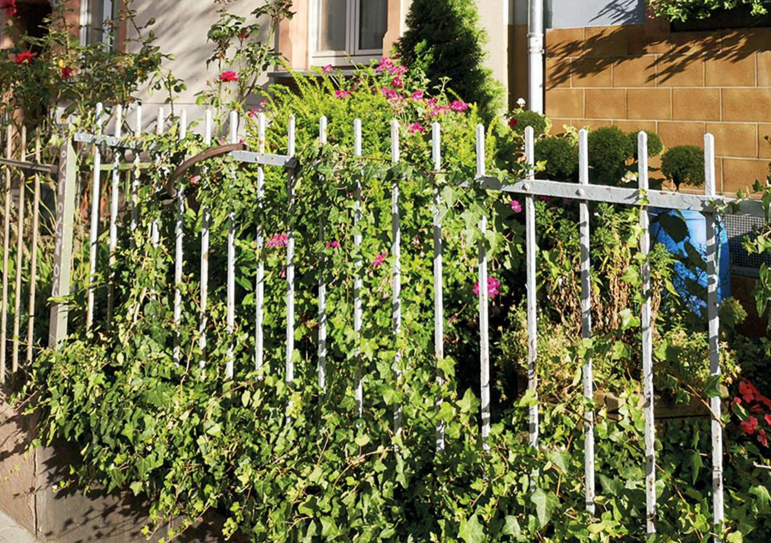
Abb. 8: Offene Einfriedungen fördern Luftaustausch und Mikroklima.