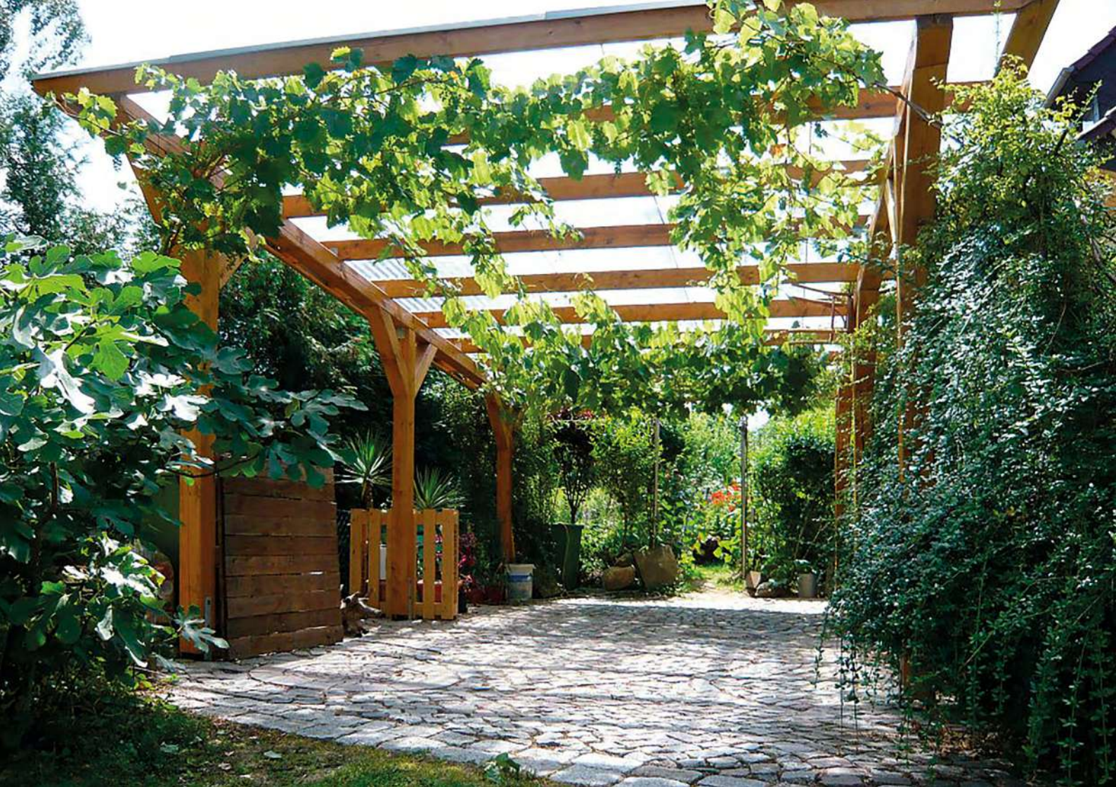
Abb. 16: Auch für Garagen und Carports kann Begrünung festgesetzt werden.