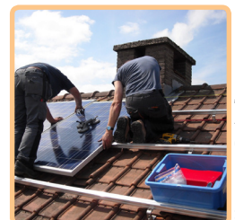
Montage von Dachaufbauten.