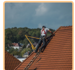
Inspektion des Dachs.