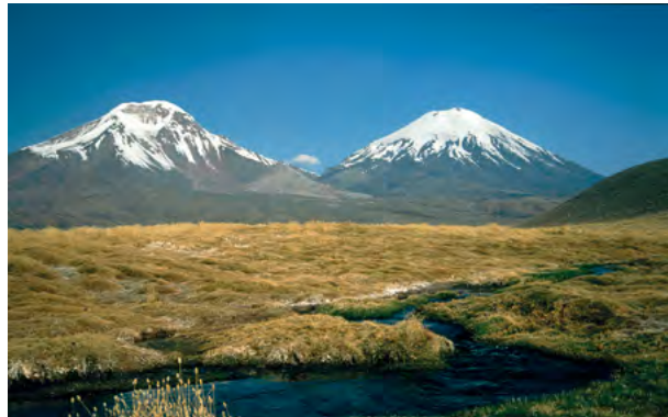
Abb. 1: Die über 6 000 m hohen Vulkane Nevados de Payachata (links Pomerape, rechts Parícuta) in den nordchilenischen Anden.

In einem Schmelzvorgang in großer Tiefe bildet sich zunächst basaltisches Magma, das beim Aufstieg an die Erdoberfläche eine Veränderung seiner chemischen Zusammensetzung hin zu einem andesitischen Magma erfährt. An der Erdoberfläche ergießt sich dieses Magma in Lavaströmen, die aber aufgrund der zähflüssigen Eigenschaften der andesitischen Lava eine geringe Flächenausdehnung besitzen. Häufiger jedoch bleibt das Magma in den Förderschloten stecken und bildet so pfropfenförmige Lavadome. Auch können pyroklastische Ablagerungen, vulkanische Brekzien und vulkanische Gänge unterschiedlichster Art eine andesitische Zusammensetzung haben.