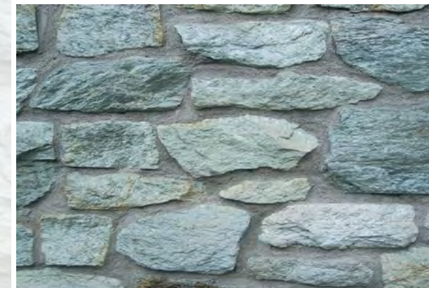
Abb. 7: Mauerstein aus Meta-Andesit

Andesit ist ein hartes und widerstandsfähiges Gestein. Aus diesem Grund findet er als Baustoff von Schotter oder Splitt im Straßen-, Wege- und Gleisbau sowie als Zuschlagstoff für die Beton- und Asphaltherstellung Verwendung. Auch eignet sich Andesit als Naturwerkstein (Abb. 7). So wurde der Meta-Andesit im Taunus zusammen mit Metarhyolith in Tagebauen gewonnen und zu Naturwerksteinen wie beispielsweise Mauersteinen, Wegeplatten oder Grabsteinen verarbeitet. Vor allem die rote und braunviolette Variante des gebrochenen Natursteins findet gerne im Landschaftsbau Verwendung. Die jüngeren tertiärzeitliche Andesite haben in Hessen dagegen keine ökonomische Bedeutung.