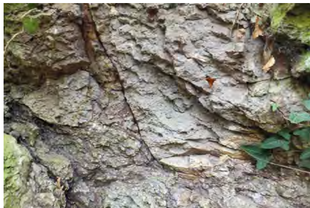
Abb. 5: Andesite und andesitische Basalte der Schöneck-Formation der Rotliegend-Zeit im aufgelassenen Steinbruch in Mühlheim-Traisa mit pillowartigen Strukturen

Während der Permzeit ereigneten sich in Mitteleuropa nach der Gebirgsbildung des heutigen Rheinschen Schiefergebirges („Variskische Orogenese“) starke intrakontinentale Senkungen der Erdkruste – große Rotliegend-Becken entstanden. Vor ca. 280–300 Millionen Jahren, zur Zeit des Rotliegend, repräsentierten Andesite in diesen Schwächezonen einen wesentlichen Teil der Förderprodukte. Die Vorkommen der Rotliegend-Andesite befinden sich heute vor allem im rheinland-pfälzischen Saar-Nahe-Gebiet, können aber auch bei Bohrungen im hessischen Teil des Oberrheingrabens in großen Tiefen angetroffen werden. In der Wetterau sowie im Bereich des Sprendlinger Horstes kam es zu Beginn der Ablagerungen der Schöneck-Formation zur Förderung andesitischer Laven und zur Sedimentation grobklastischer Sedimente mit aufgearbeiteten Andesit-Geröllen. Verbreitet sind sie vor allem längs eines südsüdwest-nordnordost verlaufenden Streifens zwischen Mühlheim-Traisa, Darmstadt und Dietzenbach. Es handelt sich um stark alterierte Andesite und andesitische Basalte, die z.T. als Pillowlaven ausgebildet sind (z.B. im Steinbruch Traisa, Abb. 5).