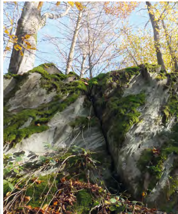
Abb. 6: Plattig absondernder hellgrauer Andesit am Wildfrauhaus, Ulrichstein-Wohnfeld im Vogelsberg

Die im Vulkangebiet Vogelsberg und im Alsberger Plateau verbreiteten andesitischen Gesteine haben ein relativ junges Alter. Sie sind im Tertiär vor ca. 15 Millionen Jahren entstanden. Bei den Klippen des „Wildfrauhaus“ (Abb. 6) von Ulrichstein im Vogelsberg handelt es sich um einen tholeiitsichen Andesit, der als Nord-Süd verlaufender Gang aus dem umgebenden Gestein herauspräpariert wurde. Der basaltische Andesit des Alsberger Plateaus im Spessart hingegen ist Teil der „Alsberger Decke“.