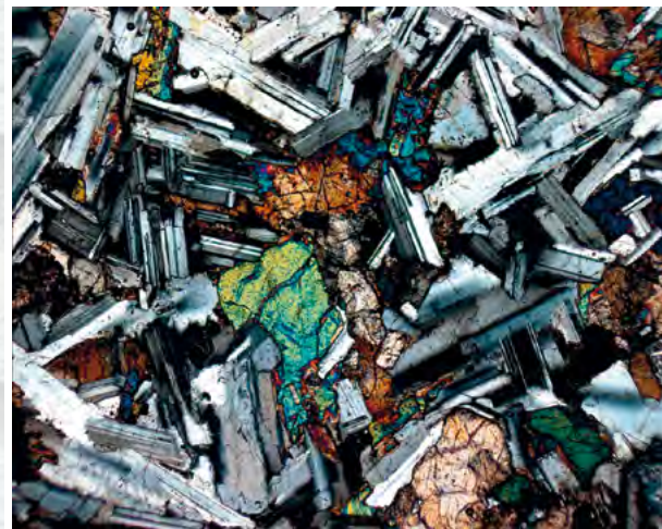
Abb. 2: Oberes Bild: Meta-Andesit („Grünschiefer“) der Silurzeit im Taunus, Lokalität Falkensteiner Burghain, unter gekreuzten Polarisatoren ist deutlich der metamorphe Charakter anhand der Feinkörnigkeit und Vorzugsrichtung der Minerale zu erkennen (Bildbreite ca. 5 mm). Unteres Bild: Tertiärer Andesit im Vogelsberg, Lokalität Wildfrauhaus bei Ulrichstein-Wohnfeld, unter gekreuzten Polarisatoren sind nicht eingeregelter Feldspat-Einsprenglinge (grau) sowie Pyroxene (grün, braun) und Olivine (schwarz) zu sehen (Bildbreite 2,8 mm).