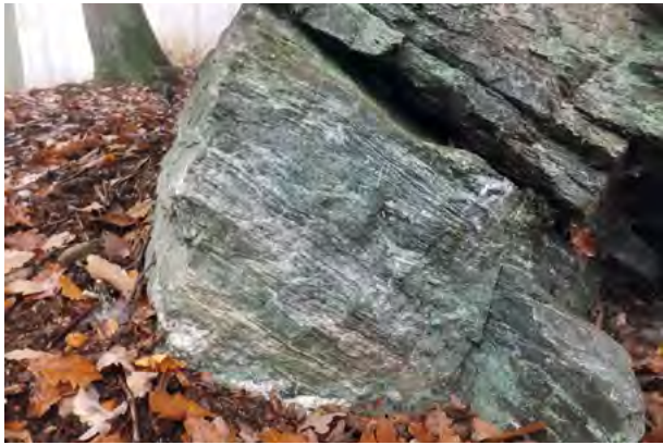
Abb. 4: Schieferige bis gneisartige Textur eines Meta-Andesit (Grünschiefer) am Hohle-Stein bei Ruppertshain

Phyllitzone, die den Verlauf einer variskischen Suturezone (zwischen dem Südrand von Avalonia und der Mitteldeutschen Kristallinschwelle) markiert. Hier treten die am stärksten deformierten Gesteinseinheiten des Taunus auf. Sie wurden bei der Kollision der Urkontinente tektonisch zusammengeschoben. Die „Meta-Andesite“ der Rossert-Metaandesit-Formation, die Kennzeichen eines Inselbogen-Vulkanismus aufweisen, haben ein hohes erdgeschichtliches Alter von ca. 442 Millionen Jahren (Silur) und sind stark metamorph überprägt. Aufgrund ihres schieferigen Gefüges wurden diese Vorkommen früher als „Grünschiefer“ bezeichnet und haben sowohl makro- als oft auch mikroskopisch keine Ähnlichkeit mehr zu jungen tertiären Andesiten. Nach geochemischen Kriterien können die Gesteine der Rossert-Metaandesit-Formation als Andesite, Trachyandesite und Rhyodazite/Dazite klassifiziert werden. Die „Grünschiefer“ sind häufig mit petrographisch ähnlichen aber helleren und weicheeren „Seritzitgneisen“ (Metarhyolithen) vergesellschaftet („bimodaler Vulkanismus!“) und weisen ihre größte Verbreitung zwischen Niederjosbach und Bad Homburg auf (so z.B. bei Kelkheim-Ruppertshain (Abb. 4).