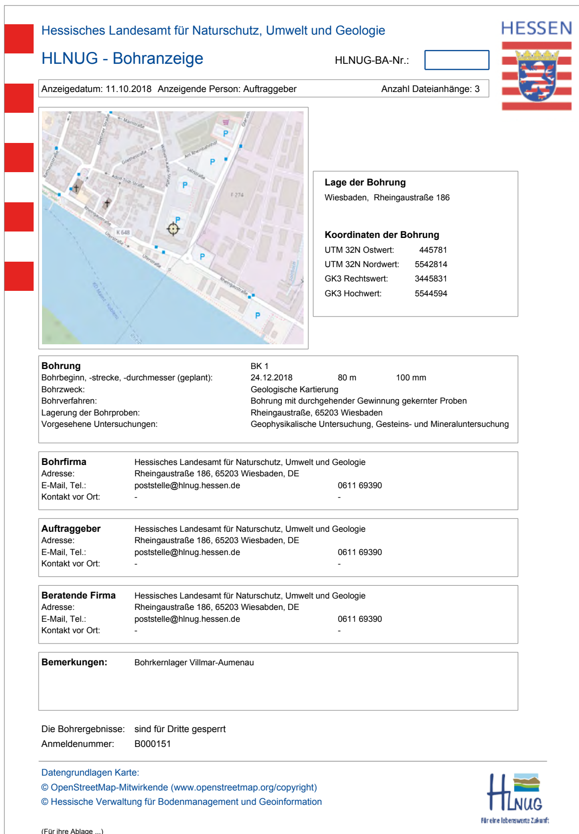
Abb. 5: Ein PDF fasst sämtliche gemachten Angaben zur ausgefüllten Bohranzeige zusammen