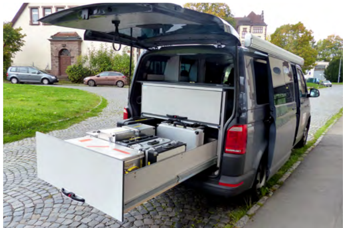
Abb. 3: Der Einsatzwagen des Dezernats I5 für Zwischenfälle mit radioaktiven Stoffen