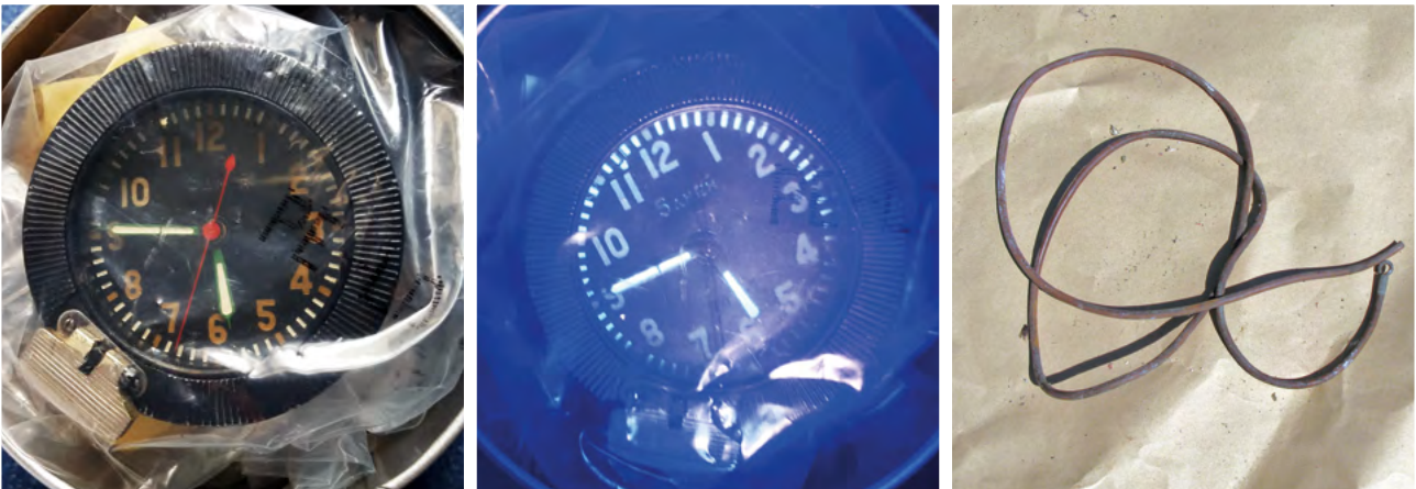
Abb. 5: Radiumleuchtfarbe am Beispiel einer Uhr und einer Radiumleuchtschnur

Uhren, sondern unter anderem auch Kompassnadeln und Schalter mit der Leuchtfarbe bemalt, damit diese auch im Dunkeln ablesbar waren. Solange die Leuchtfarbe in einer umschlossenen Hülle ist, wie hinter der Glasscheibe einer Uhr, geht von der direkten Strahlung keine große Gefahr aus. So hat das Radium (Ra-226), das auf der Uhr aus Abbildung 5 aufgetragen ist, nur eine Aktivität von ungefähr 630 Becquerel. In einem Meter Abstand entspricht diese Aktivität unter Berücksichtigung der Tochternuklide des Radiums einer Dosisleistung von 0,13 Nanosievert pro Stunde. Dies entspricht einer Jahresdosis von ungefähr einem Mikrosievert, sofern man sich permanent in diesem Abstand zur Uhr befindet. Dieses ist nur ein geringer Anteil (ein Tausendstel) der natürlichen Strahlenexposition in Deutschland. Allerdings kann von der Leuchtfarbe eine deutlich höhere Gefahr ausgehen, wenn diese inkorporiert wird. Dies kann