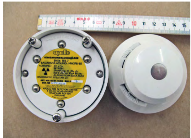
Abb. 7: Ionisationsrauchmelder

exposition als äußerst gering zu betrachten. Eine Inkorporation (wie Verschlucken des Strahlers) stellt auf Grund der Strahleneigenschaften ein erhöhtes gesundheitliches Risiko dar.