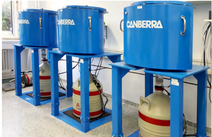
Abb. 2: Gammaskopierische Einrichtungen für den mobilen Einsatz und im Laborbetrieb