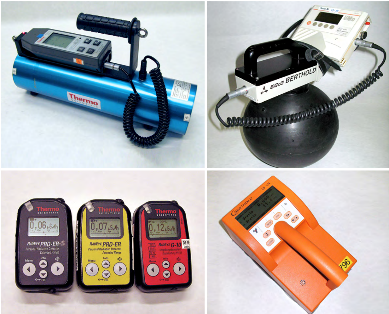
Abb. 1: Ausgewählte mobile Messgeräte im Einsatzfall für die Messung der Ortsdosisleistung, Neutronenstrahlung oder Oberflächenkontamination

Ist eine umfassendere radiologische Beurteilung und Bewertung aufgrund der Komplexität der Situation mit Hilfe der erwähnten mobilen Messeinrichtungen nicht möglich, stehen weitere hochsensible Messeinrichtungen in den Laboren im HLNUG für zusätzliche Analysen zur Verfügung (siehe Abbildung 2).