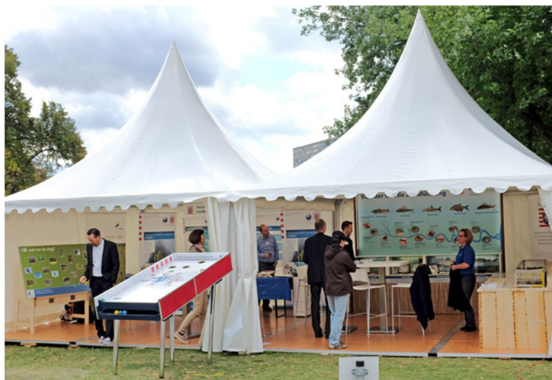
Abb. 15: Das Festzelt mit der HLUG-Fließrinne.

Das Präsidentenland Hessen stellte sich beim Tag der offenen Tür des Bundesrats am 5. September 2015 mit landestypischen Ständen und Angeboten vor. Mit dabei war das Hessische Landesamt für Umwelt und Geologie mit seinem Informationsstand „Von der Quelle bis zur Mündung“. Er zeigt die Leitarten der Lebensgemeinschaften in den verschiedenen Gewässerabschnitten sowohl schematisch an einer Tafel als auch anhand präparierter Organismen. Interessierte Bürgerinnen und Bürger konnten sich so über das Leben in Fließgewässern informieren. In einer gläsernen Fließrinne gab es zahlreiche lebende Vertreter der Lebensgemeinschaft eines Mittelgebirgsbaches zu entdecken, wie z. B. Eintagsfliegenlarven, Köcherfliegenlarven, Bachflohkrebse, Egel und Schnecken.