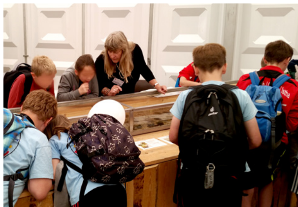
Abb. 8: Der gläserne Bach – Ein Magnet für Kinder.

Zahlreiche Angebote für Kleine und Große gab es beim Hessentag 2015 in Hofgeismar, der ein Hessentag der kurzen Wege war. Ein Fußweg von fünf Minuten führte von Halle 1 der Landesausstellung zum Dioramazelt bei Natur auf der Spur. In beiden Bereichen präsentierte das Hessische Landesamt für Umwelt und Geologie (HLUG) eine Auswahl von Umweltthemen. In der Landesausstellung berichteten wir über einen Teil unseres Internetangebotes und über das Schwerpunktthema Fracking. Hierzu gab es viele Fragen bei den Besucherinnen und Besuchern. Der gläserne Bach des HLUG bei Natur auf der Spur zog vor allem Schulklassen und Familien mit Kindern an. Sie lernten etwas über die Kleinlebewesen in Fließgewässern, die es zu entdecken gab.