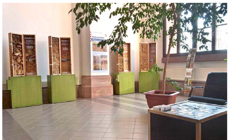
Abb. 2: Bodenprofile und Tisch mit Bodenmemory.

2015 war das Internationale Jahr des Bodens. Damit sollte dieses Medium, das lebensnotwendig, aber auch gefährdet ist, in den Blickpunkt gerückt werden. Neben zahlreichen Veranstaltungen präsentierte das HLUG im Foyer seines Hauptsitzes in Wiesbaden auch eine ganzjährige Bodenausstellung. Die Ausstellung spannte einen Bogen von der Bodenentstehung über Bodenbestandteilen und -leben bis hin zur Bodennutzung, der Bodendiversität in der Landschaft und dem Bodenschutz. Dazu kamen eindrucksvolle Bodenprofile, die das Potenzial des Bo-