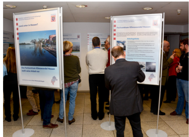
Abb. 1: Eröffnung der Ausstellung im Ministerium.