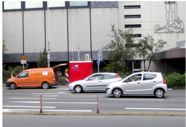
Abb. 9: Die Messstation an der Schiede.

http://www.hlnug.de/?id=9231&station=1214