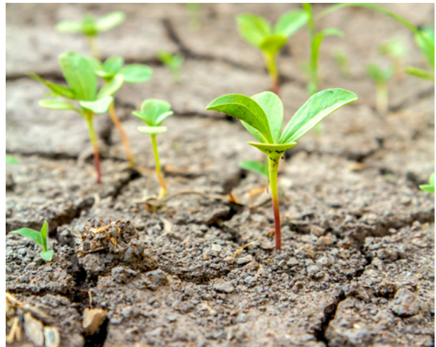
Abb. 13: Das schwindende Wachstumsmedium Boden