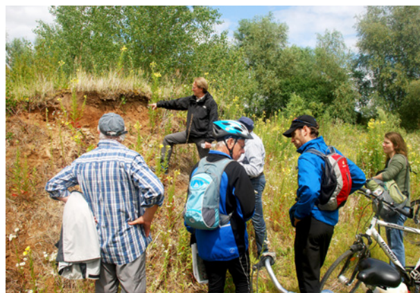
Abb. 11: Boden-Station bei der Fahrradexkursion.