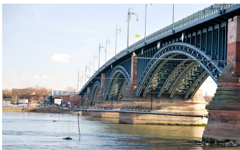
Abb. 4: Ausleger der Probenahme an der Rheinwasseruntersuchungsstation Mainz-Wiesbaden.

Wie steht es um die chemische Gewässergüte des Rheins? Welche Stoffe und Messgrößen werden untersucht und bewertet und woher stammen die verschiedenen Inhaltsstoffe des Wassers. Antworten auf diese und weitere Fragen bekamen die Besucher der Rheinwasser-Untersuchungsstation Mainz/Wiesbaden am 22. März 2015, dem Weltwassertag. Das HLUG und das Landesamt für Umwelt, Wasserwirtschaft und Gewerbeaufsicht Rheinland-Pfalz hatten ihre gemeinsame Station an diesem Sonntag für einige Stunden geöffnet. Mit von der Partie waren auch die Wasserschutzpolizei