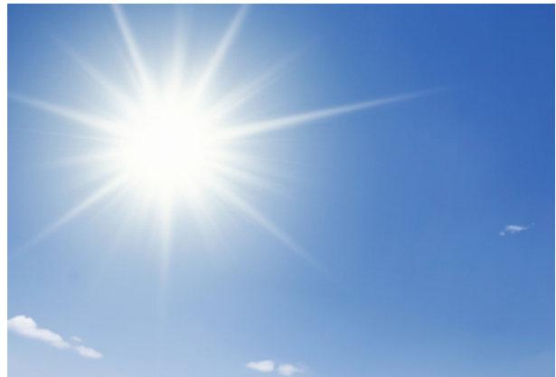
Abb. 14: Energiereiche Sonnenstrahlung trägt zur bodennahen Ozonbildung bei.