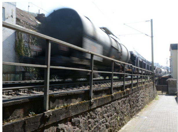
Abb. 6: Zugverkehr an der Messstation.

Am 29. April 2015, dem Tag gegen Lärm, hat das HLUg eine zweite Bahnlärmmessstation in Lorchhausen in Betrieb genommen. Bei einer öffentlichen Veranstaltung im Lorcher Hilchenhaus stellte das Amt interessierten Bürgerinnen und Bürgern die neue Station vor. Außerdem wurden ihnen Messwert-Auswertungen der seit 2010 betriebenen Bahnlärmmessstation Rüdesheim-Assmannshausen präsentiert. An der neuen Messstation werden, wie in Assmannshausen auch, ausschließlich Lärmimmissionen gemessen. Der Standort in Lorchhausen wurde gewählt, um weitere Erkenntnisse zu der Lärmsituation insbesondere in engen Ortsdurchfahrten sam-