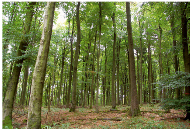
Abb. 10: Auch die Buchenwälder sind vom Klimawandel betroffen.