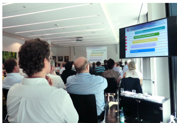
Abb. 12: Festveranstaltung in der Oberfinanzdirektion Frankfurt.