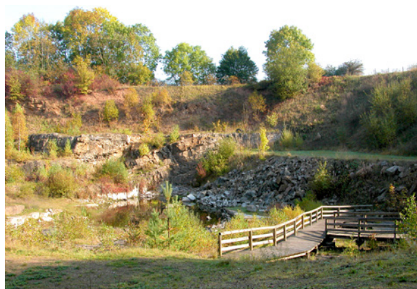
Abb. 16: Der Sandsteinbruch Cornberg.

Am „Tag des Geotops“, der jedes Jahr am 3. Sonntag im September stattfindet, werden einem interessierten Publikum Orte von erdgeschichtlicher Bedeutung vorgestellt. Geotope sind Objekte der unbelebten Natur, die Erkenntnisse über die Entstehung der Erde und die Entwicklung des Lebens vermitteln. Sie umfassen Aufschlüsse von Gesteinen, Böden, Mineralien und Fossilien sowie einzelne Naturschöpfungen und natürliche Landschaftsteile. Am 20. September 2015 hat das HLUG den Hessischen Geotop des Jahres 2016 gekürt: den Sandsteinbruch Cornberg. 25–30 Interessierte hatten den Weg in den Steinbruch bei der Gemeinde Cornberg im Landkreis Hersfeld-Rotenburg gefunden. Im Rahmen einer Führung konnten sie sich über die Besonderheiten des Geotops informieren.