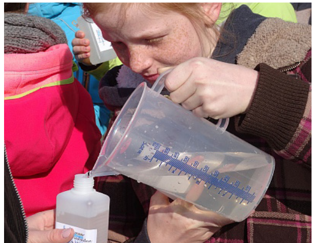
Abb. 5: Abfüllen einer Rheinwasserprobe für die Analyse.