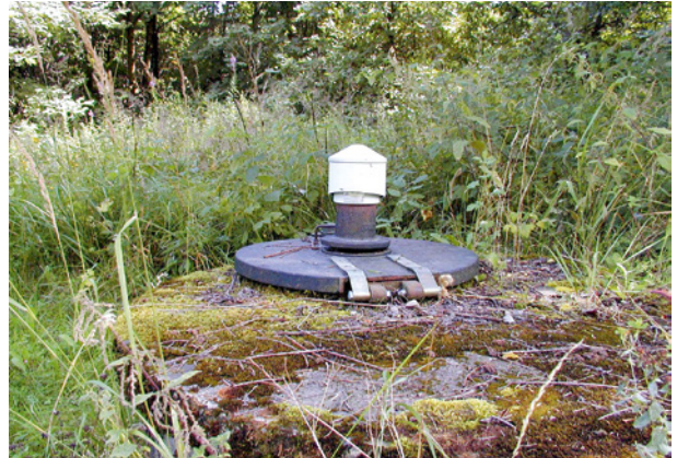
Abb. 17: Grundwassermessstelle im Taunus.