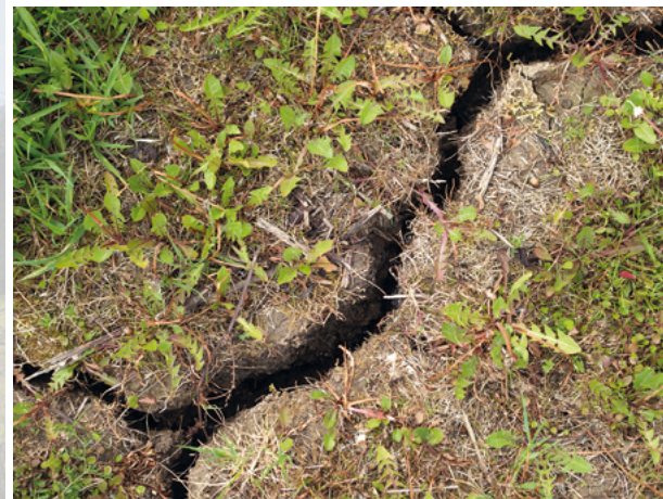
Schrumpfrisse an der Bodenoberfläche.

Pelosole bestehen zu mehr als 45% aus Ton und besitzen eine Grundstruktur aus scharfkantigen Polyedern oder senkrecht stehenden Prismen. Diese entstehen durch den Wechsel von Quellung und Schrumpfung. Wie deutlich sie ausgeprägt sind, hängt dabei von der Art der im Boden vorhandenen Tonminerale ab. Besonders quellfähig sind z. B. Vermiculite und Smectite. Bei Durchfeuchtung quellen die Bodenteilchen und es entsteht eine zusammenhängende Matrix. Trocknet der Boden aus, bilden sich oft dezimetertiefe Schrumpfrisse.