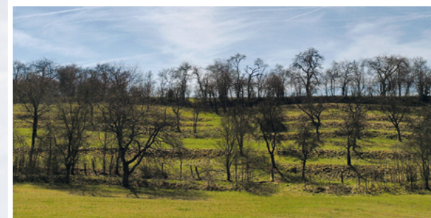
Streuobstwiese auf alten Ackerterrassen

Pelosole sind meistens mit Nährstoffen gut versorgt. Obwohl der Bodentyp viel Wasser speichern kann, ist davon nur ein begrenzter Anteil pflanzenverfügbar. Ein großer Teil des Wassers bleibt als sogenanntes Totwasser in den vielen Feinporen des Tons eingeschlossen und kann von den Pflanzenwurzeln nicht aufgenommen werden. Im durchfeuchteten, gequollenen Zustand kann zudem Luftmangel auftreten. Entlang der Schrumpfrisse sind die Böden jedoch tief durchwurzelt. Eine natürliche Überdeckung der Tonschichten durch leichtere Bodensubstrate, z. B. durch Löss, kann die extremen Standorteigenschaften abmildern.