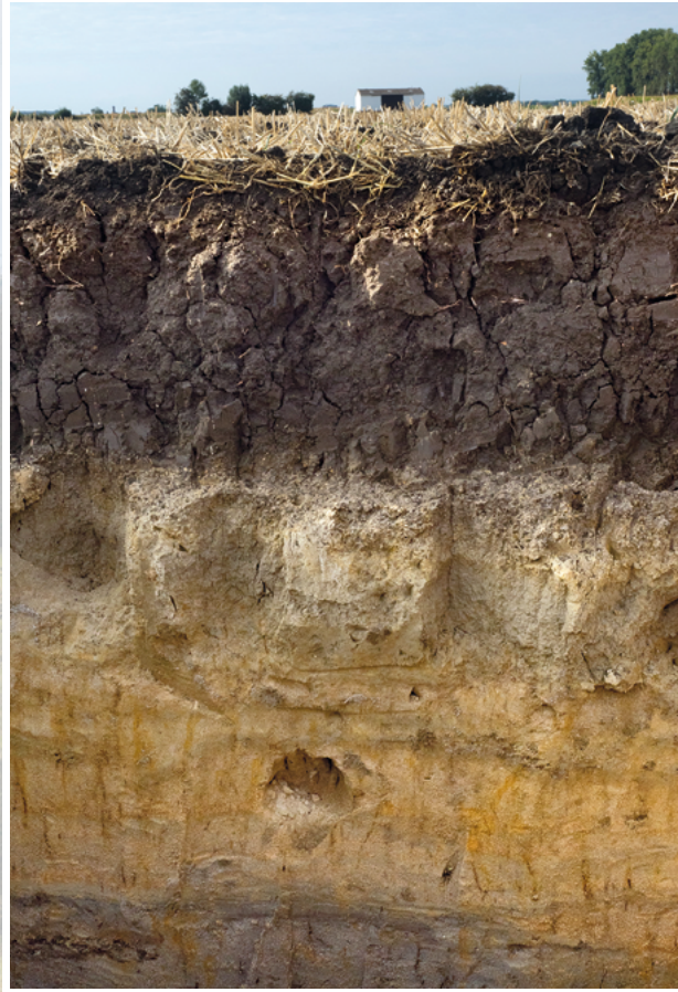
Humuspelosol aus Auenton

Pelosole kommen in Hessen regional begrenzt und zu meist vergesellschaftet mit anderen Böden vor. Ihre größte Verbreitung haben sie im Oberrheintal, wo auf Auen- und Hochfluttonen eine humusreiche Variante entstanden ist. Im hessischen Ried werden diese Humuspelosole landläufig „Brummel-Ochsen-Böden“ genannt: Als Ochsen noch mühsam den Pflug durch den schweren Boden zogen, haben sie dabei wohl missmutig gebrummt. Tongesteine des Rotliegend, des Zechsteins und des oberen Buntsandsteins sowie tertiäre Tone sind weitere mögliche Bodenausgangsgesteine. Die Karte zeigt die Verbreitung von Bodengesellschaften mit Pelosolen in Hessen.